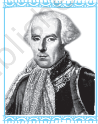
P.S. Laplace (1749-1827)

इस अध्याय में, हम केवल वास्तविक प्रविष्टियों के 3 कोटि तक के सारणिकों पर विचार करेंगे। इस अध्याय में सारणिकों के गुण धर्म, उपसारणिक, सह-खण्ड और त्रिभुज का क्षेत्रफल ज्ञात करने में सारणिकों का अनुप्रयोग, एक वर्ग आव्यूह के सहखंडज और व्युत्क्रम, रैखिक समीकरण के निकायों