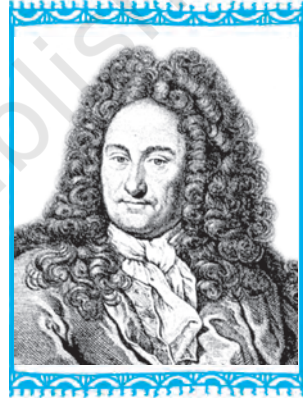
G .W. Leibnitz (1646–1716)