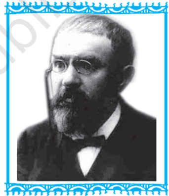
Henri Poincaré (1854-1912)

अवकल समीकरणों का उपयोग मुख्य रूप से भौतिकी, रसायन विज्ञान, जीव विज्ञान, मानव विज्ञान, भूविज्ञान, अर्थशास्त्र आदि विभिन्न क्षेत्रों में किया जाता है। अतः सभी अत्याधुनिक वैज्ञानिक अन्वेषणों के लिए अवकल समीकरणों के गहन अध्ययन की अत्यंत आवश्यकता है। इस अध्याय में, हम अवकल समीकरण की कुछ आधारभूत संकल्पनाओं, अवकल समीकरण के व्यापक एवं विशिष्ट हल, अवकल समीकरण का निर्माण, प्रथम कोटि एवं प्रथम घात के अवकल समीकरण को हल करने की कुछ विधियाँ और विभिन्न क्षेत्रों में अवकल समीकरणों के कुछ उपयोगों के बारे में अध्ययन करेंगे।