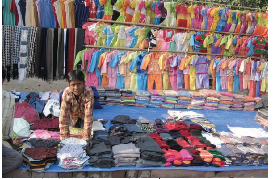
सिलेसिलिए वस्त्रों के छोटे व्यापारी बहुराष्ट्रीय कंपनियों के ब्रांड और आयात दोनों से कड़ी प्रतिस्पर्धा का सामना करते हुए।

सामान्यतः व्यापार के खुलने से वस्तुओं का एक बाजार से दूसरे बाजार में आवागमन होता है। बाजार में वस्तुओं के विकल्प बढ़ जाते हैं। दो बाजारों में एक ही वस्तु का मूल्य एक समान होने लगता है। अब दो देशों के उत्पादक एक दूसरे से हजारों मील दूर होकर भी एक दूसरे से प्रतिस्पर्धा कर सकते हैं। इस प्रकार, विदेश व्यापार विभिन्न देशों के बाजारों को जोड़ने या एकीकरण में सहायक होता है।