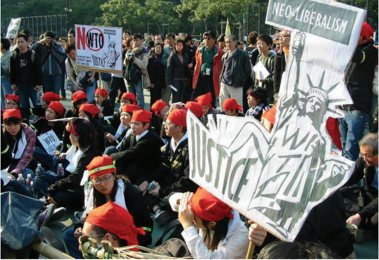
हांगकांग में डब्ल्यू.टी.ओ. के खिलाफ प्रदर्शन-2005