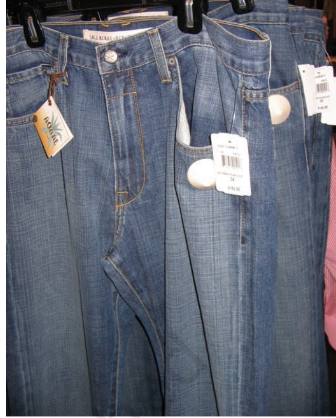
विकासशील देशों में उत्पादित जीन्स अमेरिका में 6500 रु. में बेची जा रही है।

छोटे उत्पादकों द्वारा उत्पादन किया जाता है। बहुराष्ट्रीय कंपनियों को इन उत्पादों की आपूर्ति की जाती है। फिर इन्हें अपने ब्राण्ड नाम से ग्राहकों को बेचती हैं। इन बड़ी कंपनियों में दूरस्थ उत्पादकों के मूल्य, गुणवत्ता, आपूर्ति और श्रम-शतों का निर्धारण करने की प्रचण्ड क्षमता होती है।