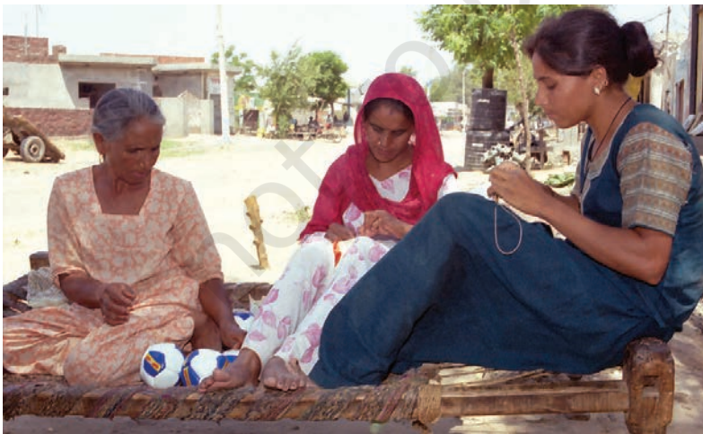
लुधियाना के एक घर में एक बड़ी बहुराष्ट्रीय कंपनी के लिए फुटबाल-निर्माण का चित्र

बहुराष्ट्रीय कंपनियाँ एक अन्य तरीके से उत्पादन नियंत्रित करती हैं। विकसित देशों की बड़ी बहुराष्ट्रीय कंपनियाँ छोटे उत्पादकों को उत्पादन का ऑर्डर देती हैं। वस्त्र, जूते-चप्पल एवं खेल के सामान जैसे उद्योग हैं, जहाँ विश्वभर में बड़ी संख्या में