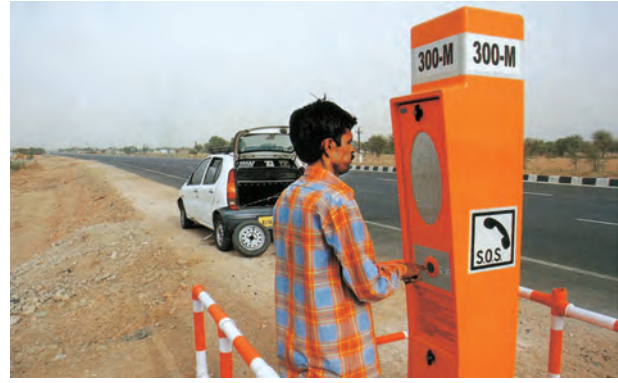
चित्र 7.10 – राष्ट्रीय राजमार्ग-48 पर एक आपातकालीन कॉल बॉक्स

डिजिटल भारत एक ज्ञान आधारित परिवर्तन के लिए, भारत को तैयार करने के लिए एक विशाल कार्यक्रम है। डिजिटल भारत कार्यक्रम का मुख्य उद्देश्य IT (भारतीय प्रतिभा) +IT (सूचना प्रौद्योगिकी)=IT (कल का भारत) में होने वाले परिवर्तन को समझना है और तकनीक को केन्द्र में रखकर बदलाव लाना है।