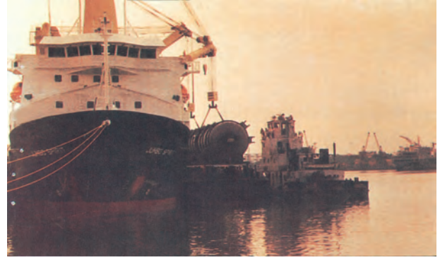
चित्र 7.8 – बड़े आकार के कार्गो को उठाने-रखने की सुविधाओं से युक्त तूतीकोरन पत्तन

पूर्वी तट के साथ तमिलनाडु में दक्षिण-पूर्वी छोर पर तूतीकोरन पत्तन है। यह एक प्राकृतिक पोताश्रय है तथा इसकी पृष्ठभूमि भी अत्यंत समृद्ध है। अतः यह पत्तन हमारे पड़ोसी देशों जैसे – श्रीलंका, मालदीव आदि तथा भारत के तटीय क्षेत्रों की भिन्न वस्तुओं के व्यापार को संचालित करता है। चेन्नई हमारे देश का प्राचीनतम कृत्रिम पत्तन है। व्यापार की मात्रा तथा लदे सामान के संदर्भ में इसका मुंबई के बाद दूसरा स्थान है। विशाखापट्टनम स्थल से घिरा, गहरा व सुरक्षित पत्तन है। प्रारम्भ में यह पत्तन लौह-अयस्क निर्यातक के रूप में विकसित किया गया था। ओडिशा में स्थित पारादीप पत्तन विशेषतः लौह-अयस्क का निर्यात करता है। कोलकाता एक अंतःस्थलीय नदीय (Riverine) पत्तन है। यह पत्तन गंगा-ब्रह्मपुत्र बेसिन के वृहत् व समृद्ध पृष्ठभूमि को सेवाएँ प्रदान करता है। ज्वारीय (Tidal) पत्तन होने के कारण तथा हुगली के तलछट जमाव से इसे नियमित रूप से साफ करना पड़ता है। कोलकाता पत्तन पर बढ़ते व्यापार को कम करने हेतु हल्दिया सहायक पत्तन के रूप में विकसित किया गया है।