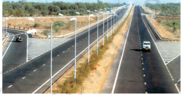
चित्र 7.1 – अहमदाबाद-वडोदरा द्रुतमार्ग