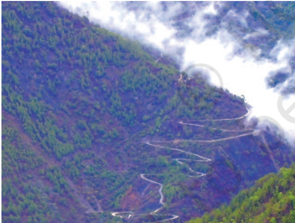
चित्र 7.3 – पहाड़ी रास्ते