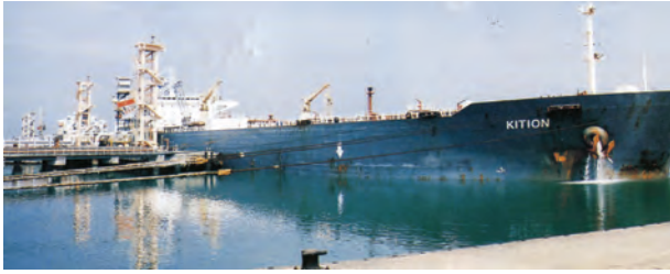
चित्र 7.7 – न्यू-मंगलौर पत्तन पर टैंकर द्वारा कच्चे तेल का निर्वहन

पत्तन की सुविधा भी प्रदान कर सके। लौह-अयस्क के निर्यात के संदर्भ में मारमागाओ पत्तन देश का महत्त्वपूर्ण पत्तन है। यहाँ से देश के कुल निर्यात का आधा (50 प्रतिशत) लौह-अयस्क निर्यात किया जाता है। कर्नाटक में स्थित न्यू-मैंगलोर पत्तन कुद्रेमुख खानों से निकले लौह-अयस्क का निर्यात करता है। सुदूर दक्षिण-पश्चिम में कोची पत्तन है; यह एक लैगून के मुहाने पर स्थित एक प्राकृतिक पोताश्रय है।