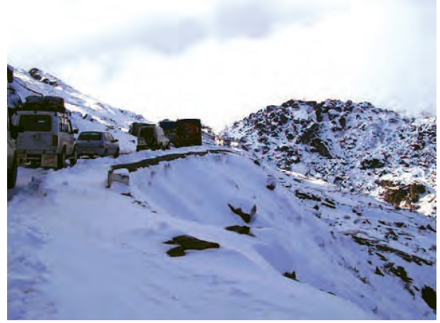
चित्र 7.4 – उत्तरी-पूर्वी सीमा सड़क पर यातायात (अरुणाचल प्रदेश)