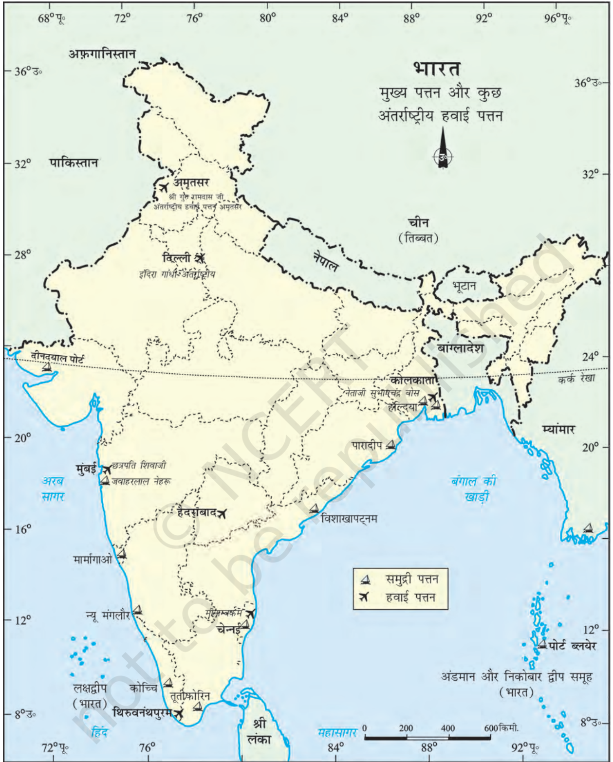
भारत - मुख्य पत्तन और कुछ अंतर्राष्ट्रीय हवाई पत्तन