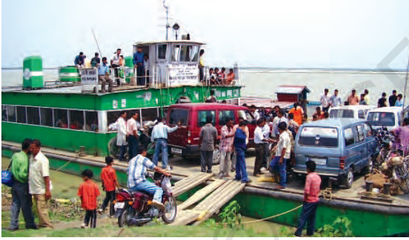
चित्र 7.5 – उत्तर-पूर्वी राज्यों में आंतरिक जलमार्ग परिवहन अधिक महत्वपूर्ण है

भारत के लोग प्राचीनकाल से समुद्री यात्राएँ करते रहे हैं। इसके नाविकों ने दूर तथा पास के क्षेत्रों में भारतीय संस्कृति व व्यापार को फैलाया है। जल परिवहन, परिवहन का सबसे सस्ता साधन है। यह भारी व स्थूलकाय वस्तुएँ ढोने में अनुकूल है। यह परिवहन साधनों में ऊर्जा सक्षम तथा पर्यावरण अनुकूल हैं। भारत में अंतः स्थलीय नौसंचालन जलमार्ग 14,500 किमी. लंबा है। इसमें केवल 5,685 किमी. मार्ग ही मशीनीकृत नौकाओं द्वारा तय किया जाता है।