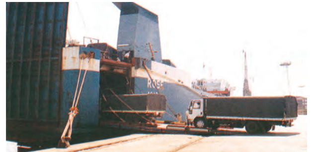
चित्र 7.6 – मुंबई पत्तन में जहाज पर ट्रकों को ले जाते हुए

मुंबई वृहत्तम पत्तन है जिसके प्राकृतिक खुले, विस्तृत व सुचारु पोताश्रय हैं। मुंबई पत्तन के अधिक परिवहन को ध्यान में रखकर इसके सामने जवाहरलाल नेहरू पत्तन विकसित किया गया जो इस पूरे क्षेत्र को एक समूह