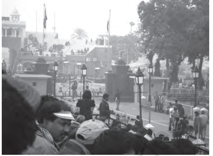
चित्र 8.1 बाघा बॉर्डर केवल पर्यटन स्थल ही नहीं बल्कि भारत तथा पाकिस्तान के

पाकिस्तान: द्वारा अपनायी गई विभिन्न आर्थिक नीतियों पर विचार करते हुए आप यह देखेंगे