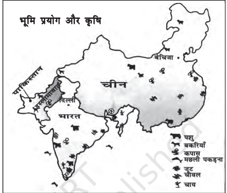
चित्र 8.2 भारत, चीन तथा पाकिस्तान में भूमि-प्रयोग तथा कृषि (स्केल के अनुसार नहीं)

चीन में प्रजनन दर भी बहुत कम है और पाकिस्तान में बहुत अधिक। चीन में नगरीकरण अधिक है। भारत में नगरीय क्षेत्रों में 34 प्रतिशत लोग रहते हैं।