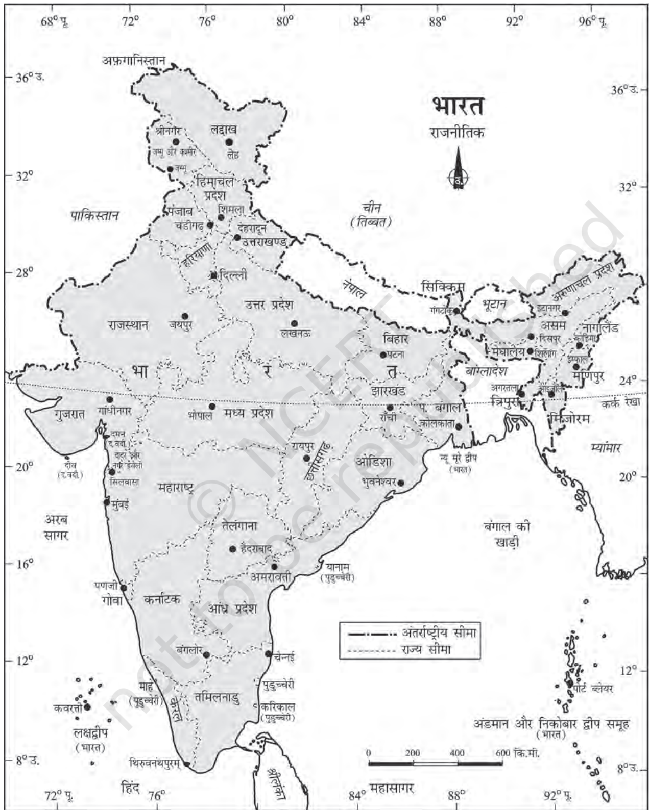
चित्र 1.1 : भारत : राजनीतिक