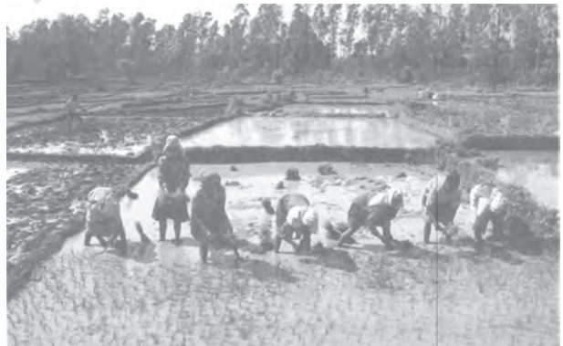
चित्र 2.4 : उत्तरी मैदान

तराई से दक्षिण में मैदान है जो पुराने और नए जलोढ़ से बना होने के कारण बाँगर और खादर कहलाता है। इस मैदान में नदी की प्रौढ़ावस्था में बनने वाली अपरदनी और निक्षेपण स्थलाकृतियाँ, जैसे- बालू-रोधिका, विसर्प, गोखुर झीलें और गुंफित नदियाँ पाई जाती हैं। ब्रह्मपुत्र घाटी का मैदान नदीय द्वीप और बालू-रोधिकाओं की उपस्थिति के लिए जाना जाता है। यहाँ ज्यादातर क्षेत्र में समय-समय पर बाढ़ आती रहती है और नदियाँ अपना रास्ता बदल कर गुंफित वाहिकाएँ बनाती रहती हैं।