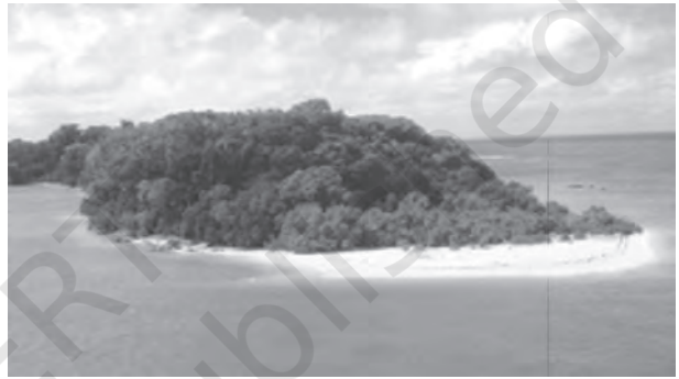
चित्र 2.8 : एक द्वीप

किलोमीटर से 440 किलोमीटर दूर स्थित है। पूरा द्वीप समूह प्रवाल निक्षेप से बना है। यहाँ 36 द्वीप हैं और इनमें से 11 पर मानव आवास है। मिनिकॉय सबसे बड़ा द्वीप है जिसका क्षेत्रफल 453 वर्ग किलोमीटर है। पूरा द्वीप समूह 9 डिग्री चैनल द्वारा दो भागों में बाँटा गया है, उत्तर में अमीनी द्वीप और दक्षिण में कनानोरे द्वीप। इस द्वीप समूह पर तूफ़ान निर्मित पुलिन हैं जिस पर अबद्ध गुटिकाएँ, शिंगिल, गोलाशिमकाएँ तथा गोलाशम पूर्वी समुद्र तट पर पाए जाते हैं।