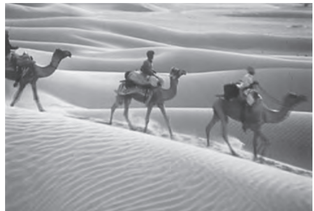
चित्र 2.6 : भारतीय मरुस्थल

विशाल भारतीय मरुस्थल अरावली पहाड़ियों से उत्तर-पूर्व में स्थित है। यह एक ऊबड़-खाबड़ भूतल है जिस पर बहुत से अनुदैर्घ्य रेतीले टीले और बरखान पाए जाते हैं। यहाँ पर वार्षिक वर्षा 150 मिलीमीटर से कम होती है और परिणामस्वरूप यह एक शुष्क और वनस्पति रहित क्षेत्र है। इन्ही स्थलाकृतिक गुणों के कारण इसे 'मरुस्थली' के नाम से जाना जाता है। यह माना जाता है कि मेसोजोइक काल में यह क्षेत्र समुद्र का हिस्सा था। इसकी पुष्टि आकल में स्थित काष्ठ जीवाश्म पार्क में उपलब्ध प्रमाणों तथा जैसलमेर के निकट ब्रह्मसर के आस-पास के समुद्री निक्षेपों से होती है (काष्ठ जीवाश्म की आयु लगभग 18 करोड़ वर्ष आँकी गई है)। यद्यपि इस क्षेत्र की भूगर्भिक चट्टान संरचना प्रायद्वीपीय पठार का विस्तार है, तथापि अत्यंत शुष्क दशाओं के कारण इसकी धरातलीय आकृतियाँ