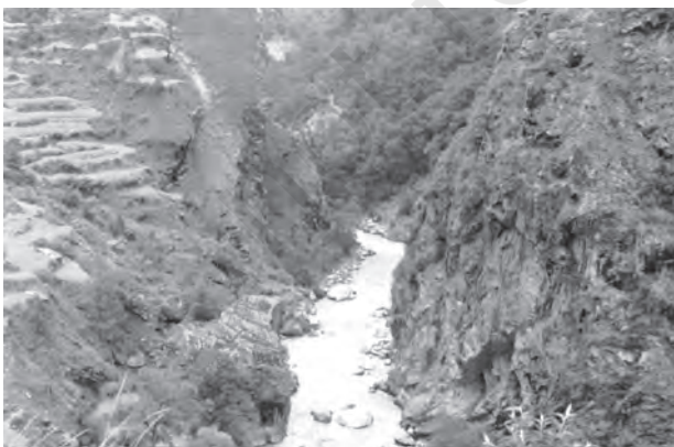
चित्र 2.1 : गॉर्ज

कठोर एवं स्थिर प्रायद्वीपीय खंड के विपरीत हिमालय और अतिरिक्त-प्रायद्वीपीय पर्वतमालाओं की भूवैज्ञानिक संरचना तरुण, दुर्बल और लचीली है। ये पर्वत वर्तमान समय में भी बहिर्जनिक तथा अंतर्जनित बलों की अंतर्क्रियाओं से प्रभावित हैं। इसके परिणामस्वरूप इनमें बलन, भ्रंश और क्षेप (thrust) बनते हैं। इन पर्वतों की उत्पत्ति विवर्तनिक हलचलों से जुड़ी है। तेज बहाव वाली नदियों से अपरदित ये पर्वत अभी भी युवा अवस्था में हैं। गॉर्ज, V-आकार घाटियाँ, क्षिप्रिकाएँ व जल-प्रपात इत्यादि इसका प्रमाण हैं।