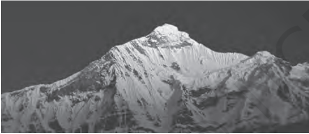
चित्र 2.3 : हिमालय

उत्तरी-पूर्वी पहाड़ियाँ शामिल हैं। हिमालय में कई समानांतर पर्वत श्रृंखलाएँ हैं। इसमें बृहत हिमालय, पार हिमालय श्रृंखलाएँ, मध्य हिमालय और शिवालिक प्रमुख श्रेणियाँ हैं। भारत के उत्तरी-पश्चिमी भाग में हिमालय की ये श्रेणियाँ उत्तर-पश्चिम दिशा से दक्षिण-पूर्व दिशा की ओर फैली हैं। दार्जिलिंग और सिक्किम क्षेत्रों में ये श्रेणियाँ पूर्व-पश्चिम दिशा में फैली हैं जबकि अरुणाचल प्रदेश में ये दक्षिण-पश्चिम से उत्तर-पश्चिम की ओर घूम जाती हैं। मिजोरम, नागालैंड और मणिपुर में ये पहाड़ियाँ उत्तर-दक्षिण दिशा में फैली हैं। बृहत हिमालय श्रृंखला, जिसे केंद्रीय अक्षीय श्रेणी भी कहा जाता है, की पूर्व-पश्चिम लंबाई लगभग 2,500 किलोमीटर तथा उत्तर से दक्षिण इसकी चौड़ाई 160 से 400 किलोमीटर है। जैसाकि मानचित्र से स्पष्ट है हिमालय, भारतीय उपमहाद्वीप तथा मध्य एवं पूर्वी एशिया के देशों के बीच एक मजबूत लंबी दीवार के रूप में खड़ा है। क्या आप भारतीय उपमहाद्वीप के देशों के नाम बता सकते हैं?