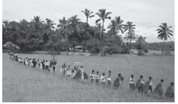
चित्र 2.7 : तटीय मैदान

पश्चिमी तटीय मैदान जलमग्न तटीय मैदानों के उदाहरण हैं। ऐसा विश्वास है कि पौराणिक शहर द्वारका, जो किसी समय पश्चिमी तट पर मुख्य भूमि पर स्थित था, अब पानी में डूबा हुआ है। जलमग्न होने के कारण पश्चिमी तटीय मैदान एक संकीर्ण पट्टी मात्र है और पत्तनों एवं बंदरगाह विकास के लिए प्राकृतिक परिस्थितियाँ प्रदान करता है। यहाँ पर स्थित प्राकृतिक बंदरगाहों में कांडला, मजगाँव, जे एल एन नावहा शेवा, मर्मागाओ, मँगलौर, कोचीन शामिल हैं। उत्तर में गुजरात तट से, दक्षिण में केरल तट तक फैले पश्चिमी तटीय मैदान को निम्नलिखित भागों में विभाजित किया जा सकता है गुजरात का कच्छ और काठियावाड़ तट, महाराष्ट्र का कोंकण तट और गोवा तट, कर्नाटक तथा केरल के क्रमशः मालाबार तट। पश्चिमी तटीय मैदान मध्य में संकीर्ण है परंतु उत्तर और दक्षिण में चौड़े हो जाते हैं। इस तटीय मैदान में बहने वाली नदियाँ डेल्टा नहीं बनाती हैं। मालाबार तट की विशेष स्थलाकृति 'कयाल' (Backwaters) जिसे