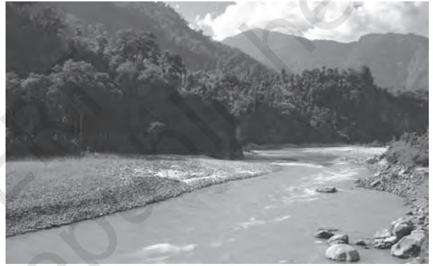
चित्र 3.1 : पर्वतीय क्षेत्र की एक नदी

दिशा से दूसरी दिशा में बहने का कारण बता सकते हैं? उत्तर में हिमालय तथा दक्षिण में पश्चिमी घाट