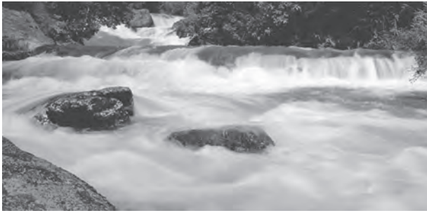
चित्र 3.3 : क्षिप्रिकाएँ

समतल घाटियों, गोखुर झीलें, बाढ़कृत मैदान, गुंफित वाहिकाएँ और नदी के मुहाने पर डेल्टा का निर्माण करती हैं। हिमालय क्षेत्र में इन नदियों का रास्ता टेढ़ा-मेढ़ा है, परंतु मैदानी क्षेत्र में इनमें सर्पाकार मार्ग में बहने की प्रवृत्ति पाई जाती है और अपना रास्ता बदलती रहती हैं। कोसी नदी, जिसे बिहार का शोक (Sorrow of Bihar) कहते हैं, अपना मार्ग बदलने के लिए कुख्यात रही है। यह नदी पर्वतों के ऊपरी क्षेत्रों से भारी मात्रा में अवसाद लाकर मैदानी भाग में जमा करती है। इससे नदी मार्ग अवरूद्ध हो जाता है व परिणामस्वरूप नदी अपना मार्ग बदल लेती है। कोसी नदी ऊपरी पर्वतीय क्षेत्र से इतनी भारी मात्रा में अवसाद क्यों लाती है? क्या आप सोचते हैं कि सामान्यतः नदियों में और विशेष तौर पर कोसी नदी में जल का बहाव व मात्रा एक समान रहती है या घटती-बढ़ती रहती है? नदी में कब जल की मात्रा अत्यधिक होती है? बाढ़ के सकारात्मक व नकारात्मक प्रभाव क्या हैं?