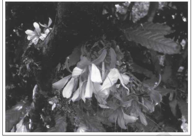
चित्र 14.3: हमबोशिया डेकरेंस बेड- दक्षिण पश्चिमी घाट ( भारत ) की एक दुर्लभ प्रजाति

विश्व की सभी संकटापन्न प्रजातियों के बारे में (Red list) रेड लिस्ट के नाम से सूचना प्रकाशित करता है।