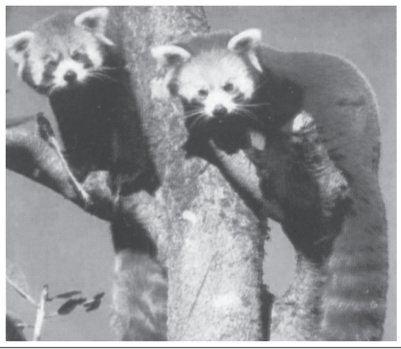
चित्र 14.2: रेड पांडा - एक संकटापन्न प्रजाति