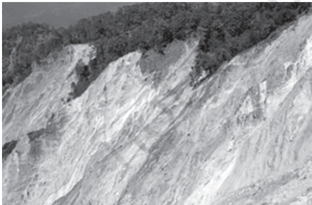
चित्र 5.3 : भारत-नेपाल सीमा, उत्तर प्रदेश में शारदा नदी के निकट शिवालिक हिमालय शृंखलाओं में भूस्खलन स्कार

ढाल, जिसपर संचलन होता है, के संदर्भ में पश्च-आवर्तन (Rotation) के साथ शैल-मलवा की एक या कई इकाइयों के फिसलन (Slipping) को अवसर्पण कहते हैं। पृथ्वी के पिंड के पश्च-आवर्तन के बिना मलवा का तीव्र लोटन (Rolling) या स्खलन मलवा स्खलन कहलाता है। मलवा स्खलन में खड़े (Vertical) या प्रलंबी फलक (Face) से मिट्टी मलवा का प्रायः स्वतंत्र पतन होता है। संस्तर जोड़ या भ्रंश के नीचे पृथक शैल बृहत् के स्खलन को शैल