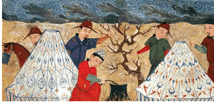
कुबलई खान और चाबी, शिविर में