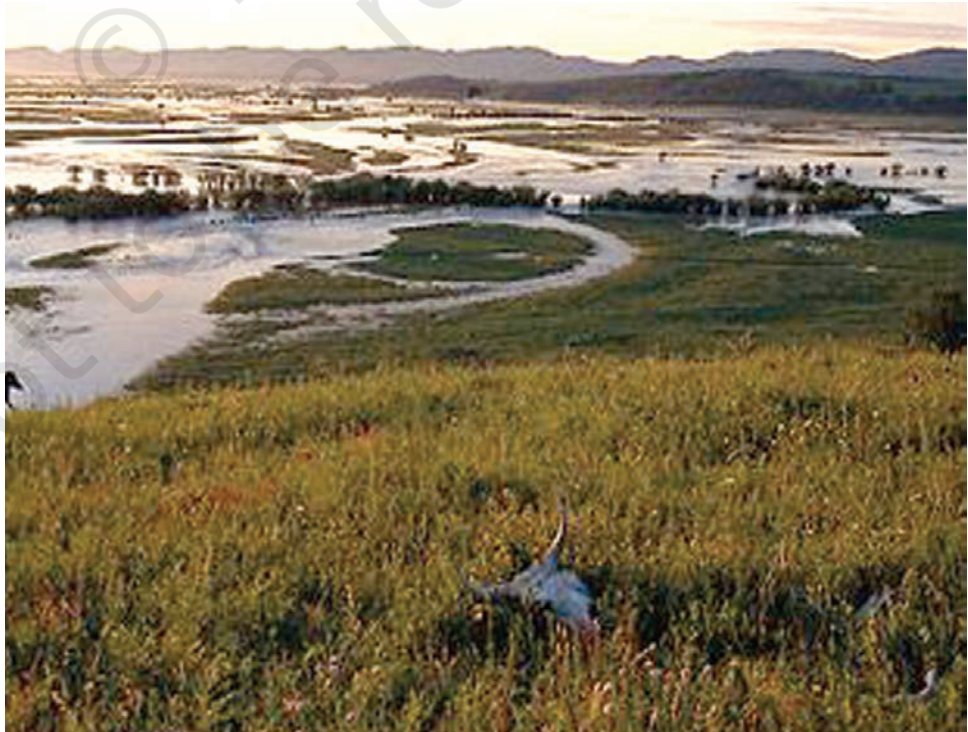
ओनोन नदी के मैदान में बाढ़।

मंगोल विविध जनसमुदाय का एक निकाय था। ये लोग पूर्व में तातार, खितान और मंचू लोगों से और पश्चिम में तुर्की कबीलों से भाषागत समानता होने के कारण परस्पर सम्बद्ध थे। कुछ मंगोल पशुपालक थे और कुछ शिकारी संग्राहक थे। पशुपालक घोड़ों, भेड़ों और कुछ हद तक अन्य पशुओं जैसे बकरी और ऊँटों को भी पालते थे। उनका यायावरीकरण मध्यएशिया की चारण भूमि (स्टेपीज) में हुआ जोकि आज के आधुनिक मंगोलिया राज्य का भूभाग है। इस क्षेत्र का परिदृश्य आज जैसा ही अत्यंत मनोरम था और क्षितिज अत्यंत विस्तृत और लहरिया मैदानों से घिरा था जिसके पश्चिमी भाग में अल्ताई पहाड़ों की बर्फ़ीली चोटियाँ थीं। दक्षिण भाग में शुष्क गोबी का मरुस्थल इसके उत्तर और पश्चिम क्षेत्र में ओनोन और सेलेंगा जैसी नदियों और बर्फ़ीली पहाड़ियों से निकले सैकड़ों झरनों के पानी से सिंचित हो रहा था। पशुचारण के लिए यहाँ पर अनेक हरी घास के मैदान और प्रचुर मात्रा में छोटे-मोटे शिकार अनुकूल ऋतुओं में उपलब्ध हो जाते थे। शिकारी-संग्राहक लोग, पशुपालक कबीलों के आवास-क्षेत्र के उत्तर में साइबेरियाई वनों में रहते