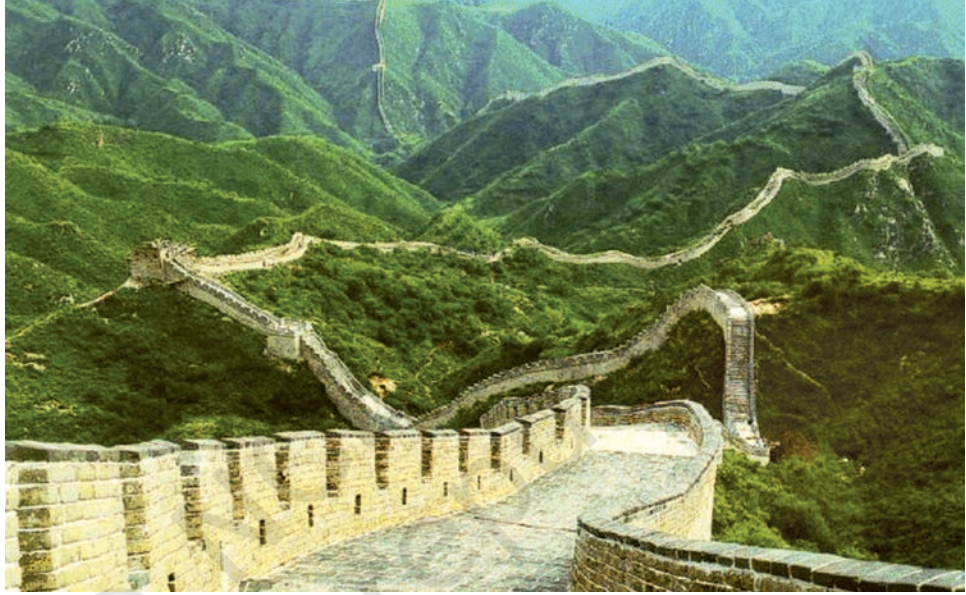
चीन की महान दीवार।

स्थायी समाज कमजोर पड़ने लगे। उन्होंने कृषि को अव्यवस्थित कर दिया और नगरों को लूटा। दूसरी ओर यायावर, लूटपाट कर संघर्ष क्षेत्र से दूर भाग जाते थे जिससे उन्हें बहुत कम हानि होती थी। अपने संपूर्ण इतिहास में चीन को इन यायावरों से विभिन्न शासन-कालों में बहुत अधिक क्षति पहुँची। यहाँ तक कि आठवीं शताब्दी ई.पू. से ही अपनी प्रजा की रक्षा के लिए चीनी शासकों ने किलेबंदी करना प्रारंभ कर दिया था। तीसरी शताब्दी ई.पू. से इन किलेबंदियों का एकीकरण सामान्य रक्षात्मक ढाँचे के रूप में किया गया जिसे आज 'चीन की महान दीवार' के रूप में जाना जाता है। उत्तरी चीन के कृषक समाजों पर यायावरों द्वारा लगातार हुए हमलों और उनसे पनपते अस्थिरता और भय का यह एक प्रभावशाली चाक्षुष साक्ष्य है।