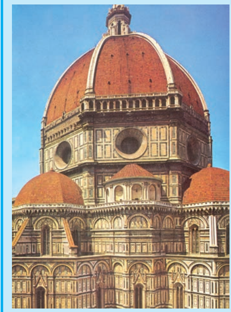
दी ड्यूमा (Duomo), फ्लोरेंस के कथीडल का गुम्बद, इसका डिजाइन ब्रूनेलेशी ने बनाया।

(Philippo Brunelleschi, 1337-1446) जिन्होंने फ्लोरेंस के भव्य गुम्बद (Duomo) का परिरूप प्रस्तुत किया था, ने अपना पेशा एक मूर्तिकार के रूप में शुरू किया। इस काल में एक और अनोखा बदलाव आया। अब कलाकार की पहचान उसके नाम से होने लगी, न कि पहले की तरह उसके संघ या श्रेणी (गिल्ड) के नाम से।