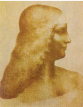
इसाबेला दि इस्ते।