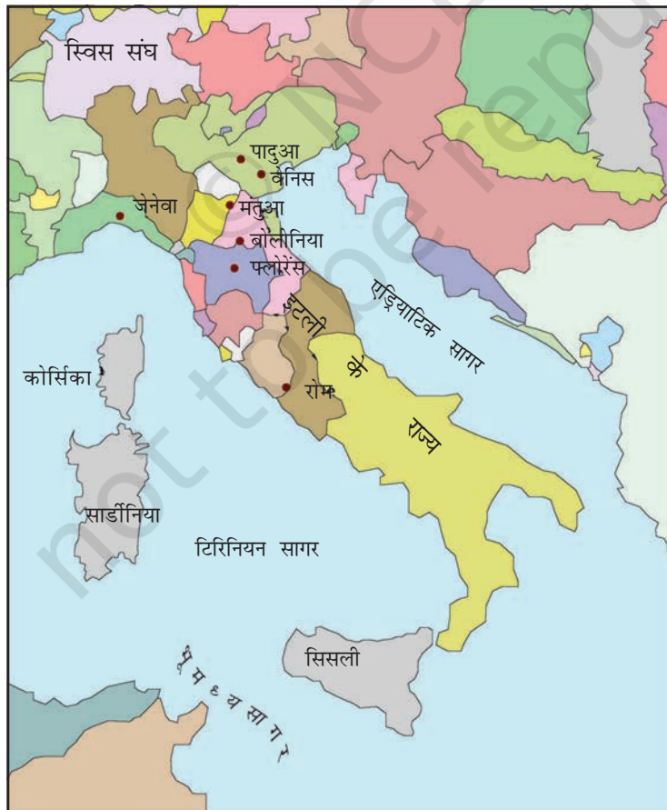
मानचित्र 1 : इटली के राज्य।

बाइज़ेंटाइन साम्राज्य और इस्लामी देशों के बीच व्यापार के बढ़ने से इटली के तटवर्ती बंदरगाह पुनर्जीवित हो गए। बारहवीं शताब्दी से जब मंगोलों ने चीन के साथ 'रेशम-मार्ग' (देखिए विषय 5) से व्यापार आरंभ किया तो इसके कारण पश्चिमी यूरोपीय देशों के व्यापार को बढ़ावा मिला। इसमें इटली के नगरों ने मुख्य भूमिका निभाई। अब वे अपने को एक शक्तिशाली साम्राज्य के अंग