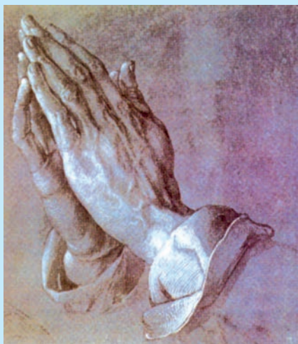
ड्यूरर का तूलिका चित्र 1508- “प्रार्थना रत हस्त”

उस काल के लोगों के विचार को आकार देने का साधन मानवतावादियों के लिए केवल औपचारिक शिक्षा ही नहीं थी। कला, वास्तुकला और ग्रंथों ने मानवतावादी विचारों को फैलाने में प्रभावी भूमिका निभाई।