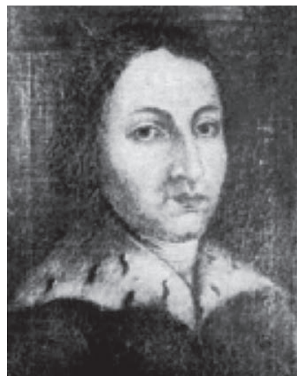
कोपरनिकस का आत्म-चित्र।

कोपरनिकस ने यह घोषणा की कि पृथ्वी समेत सारे ग्रह सूर्य के चारों ओर परिक्रमा करते हैं। कोपरनिकस एक निष्ठावान ईसाई थे और वह इस बात से भयभीत थे कि उनकी इस नयी खोज से परंपरावादी ईसाई धर्माधिकारियों में घोर-प्रतिक्रिया उत्पन्न हो सकती है। यही कारण था कि वह अपनी पाण्डुलिपि दि रिवल्यूशनिस-परिभ्रमण (De revolutionibus-परिभ्रमण) को प्रकाशित नहीं कराना चाहते थे। जब वह अपनी मृत्यु-शैया पर पड़े थे तब उन्होंने यह पाण्डुलिपि अपने अनुयायी जोशिम रिटिकस (Joachim Rheticus) को सौंप दी। उनके