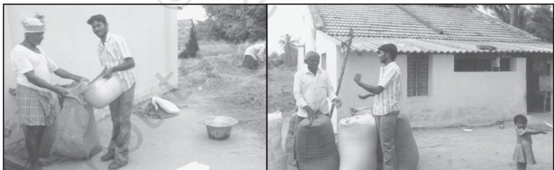
गाँव में धान की कटाई