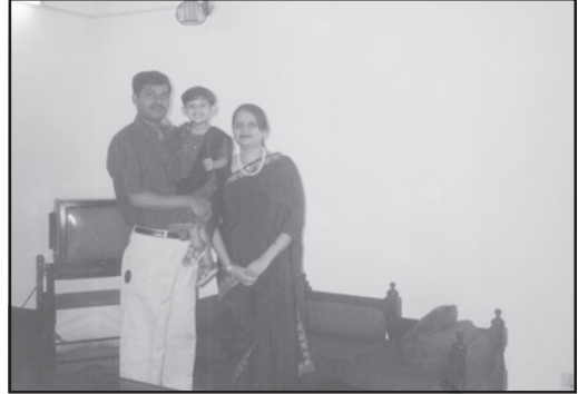
परिवारों और आवासों में अंतर पर ध्यान दीजिए