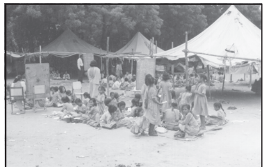
चित्रों की विवेचना करें (दो प्रकार के स्कूल)