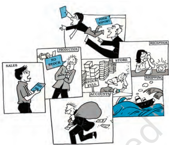
चित्र 1.5—समन्वय के न रहने से असमंजस होगा।

प्रबंधक के विभिन्न कार्यों पर साधारणतया उपरोक्त क्रम में ही चर्चा की जाती है जिसके अनुसार एक प्रबंधक पहले योजना तैयार करता है फिर संगठन बनाता है तत्पश्चात् निर्देशन करता है और अंत में नियंत्रण करता है। वास्तव में प्रबंधक शायद ही इन कार्यों को एक-एक करके करता है। प्रबंधक के कार्य एक दूसरे से जुड़े हैं तथा यह निश्चित करना कठिन हो जाता है कौन-सा कार्य कहाँ समाप्त हुआ तथा कौन-सा कार्य कहाँ से प्रारंभ हुआ।