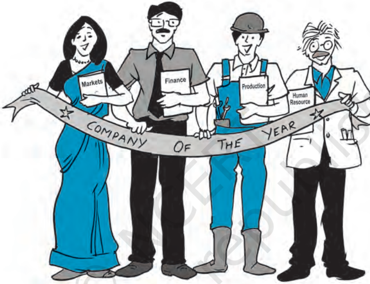
चित्र 1.1-टीम में साथ होने से प्रत्येक अधिक कार्य करता है।