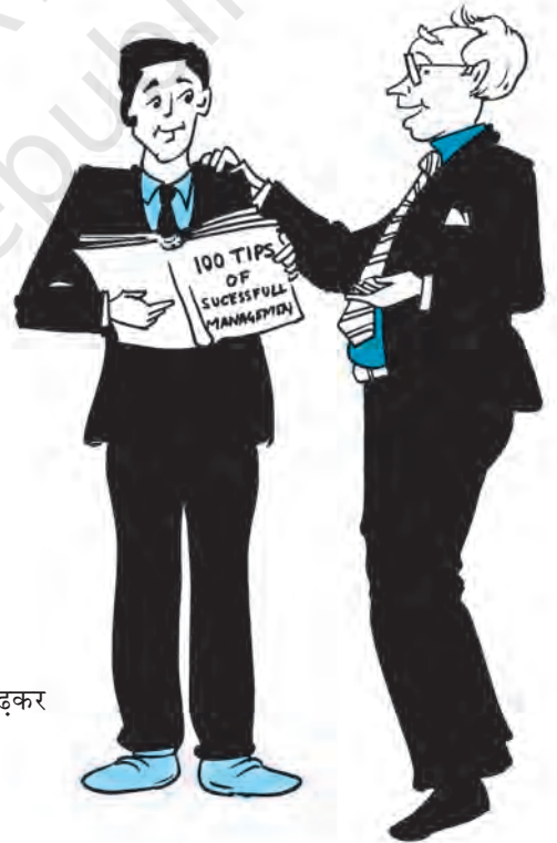
चित्र 1.3—आप सिर्फ किताबें पढ़कर प्रबंधन नहीं सीख सकते।

(ख) मध्य स्तरीय प्रबंध —ये उच्च प्रबंधकों एवं नीचे स्तर के बीच की कड़ी होते हैं, ये उच्च प्रबंधकों के अधीनस्थ एवं प्रथम रेखीय प्रबंधकों के प्रधान होते हैं। इन्हें सामान्यतः विभाग प्रमुख कहते हैं। मध्य स्तरीय प्रबंधक, उच्च प्रबंध द्वारा विकसित नियंत्रण योजनाएँ एवं व्यूह-रचना के क्रियान्वयन के लिए उत्तरदायी होते हैं। इसके साथ-साथ ये प्रथम रेखीय प्रबंधकों के सभी कार्यों