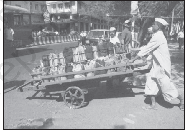
चित्र 6.4 : मुंबई में डब्बावाला सेवा

दैनिक जीवन में काम को सुविधाजनक बनाने के लिए लोगों को व्यक्तिगत सेवाएँ उपलब्ध कराई जाती हैं। कामगार रोजगार की तलाश में ग्रामीण क्षेत्रों से प्रवास करते हैं और अकुशल होते हैं। वे मोची, गृहपाल, खानसामा और माली जैसी घरेलू सेवाओं के लिए नियुक्त किए जाते हैं और इन्हें कम भुगतान किया जाता है। कर्मियों का यह वर्ग असंगठित है। ऐसा एक उदाहरण मुंबई की डब्बावाला सेवा है जो पूरे नगर में लगभग 1,75,000 उपभोक्ताओं को उपलब्ध कराई जाती है।