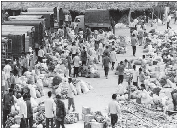
चित्र 6.2 : सब्जियों का थोक बाजार

ग्रामीण विपणन केंद्र निकटवर्ती बस्तियों का पोषण करते हैं। ये अर्ध-नगरीय केंद्र होते हैं। ये अत्यंत अल्पवर्धित प्रकार के व्यापारिक केंद्रों के रूप में सेवा करते हैं। यहाँ व्यक्तिगत और व्यावसायिक सेवाएँ सुविकसित नहीं होतीं। ये स्थानीय संग्रहण और वितरण केंद्र होते हैं। इनमें से अधिकांश केंद्रों में मंडियाँ (थोक बाजार) और फुटकर व्यापार क्षेत्र भी होते हैं। ये स्वयं में नगरीय केंद्र नहीं हैं किंतु ग्रामीण लोगों की अधिक माँग वाली वस्तुओं और सेवाओं को उपलब्ध कराने वाले महत्वपूर्ण केंद्र हैं।