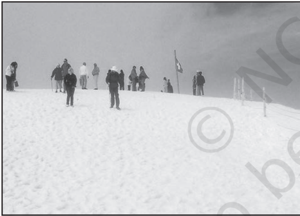
चित्र 6.5 : स्विटजरलैंड में बर्फ से ढकी पर्वत चोटी पर स्कींग करते पर्यटक

पर्यटन एक यात्रा है जो व्यापार की बजाय प्रमोद के उद्देश्यों के लिए की जाती है। कुल पंजीकृत रोजगारों तथा कुल राजस्व (सकल घरेलू उत्पाद का 40 प्रतिशत) की दृष्टि से यह विश्व का अकेला सबसे बड़ा (25 करोड़) तृतीयक क्रियाकलाप बन गया है। इनके अतिरिक्त पर्यटकों के आवास, भोजन, परिवहन, मनोरंजन तथा विशेष दुकानों जैसी सेवा उपलब्ध कराने के लिए अनेक स्थानीय व्यक्तियों को नियुक्त किया जाता है। पर्यटन अवसंरचना उद्योगों, फुटकर व्यापार तथा शिल्प उद्योगों (स्मारिका) को पोषित करता है। कुछ प्रदेशों में पर्यटन ऋतुनिष्ठ होता है क्योंकि अवकाश की अवधि अनुकूल मौसमी दशाओं पर निर्भर करती है, किंतु कई प्रदेश वर्षपर्यंत पर्यटकों को आकर्षित करते हैं।