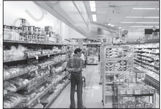
चित्र 6.3 : अमेरिका में डिब्बाबंद आहार बाजार

नगरीय बाजार केंद्रों में और अधिक विशिष्टीकृत नगरीय सेवाएँ मिलती हैं। इनमें न केवल साधारण वस्तुएँ और सेवाएँ बल्कि लोगों द्वारा वांछित अनेक विशिष्ट वस्तुएँ व सेवाएँ भी उपलब्ध होती हैं। नगरीय केंद्र, इसलिए विनिर्मित पदार्थों के साथ-साथ विशिष्टीकृत बाजार भी प्रस्तुत करते हैं जैसे श्रम बाजार, आवासन, अर्ध-निर्मित एवं निर्मित उत्पादों का बाजार। इनमें शैक्षिक संस्थाओं और व्यावसायिकों की सेवाएँ जैसे— अध्यापक, वकील, परामर्शदाता, चिकित्सक, दाँतों का डॉक्टर और पशु चिकित्सक आदि उपलब्ध होते हैं।