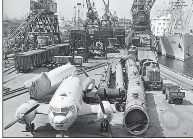
चित्र 8.5 : लेनिनग्राद का वाणिज्यिक पत्तन