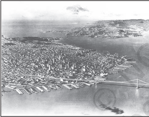
चित्र 8.4 : सैन फ्रांसिस्को, विश्व का सबसे बड़ा स्थलरुद्ध पत्तन

पत्तन जहाज़ के लिए गोदी, लादने, उतारने तथा भंडारण हेतु सुविधाएँ प्रदान करते हैं। इन सुविधाओं को प्रदान करने के उद्देश्य से पत्तन के प्राधिकारी नौगम्य द्वारों का रख-रखाव, रस्सों व बज्रों (छोटी अतिरिक्त नौकाएँ) की व्यवस्था करने और श्रम एवं प्रबंधकीय सेवाओं को उपलब्ध कराने की व्यवस्था करते हैं। एक पत्तन के महत्त्व को नौभार के आकार और निपटान किए गए जहाज़ों की संख्या द्वारा निश्चित किया जाता है। एक पत्तन द्वारा निपटायी नौभार, उसके पृष्ठ प्रदेश के विकास के स्तर का सूचक है।