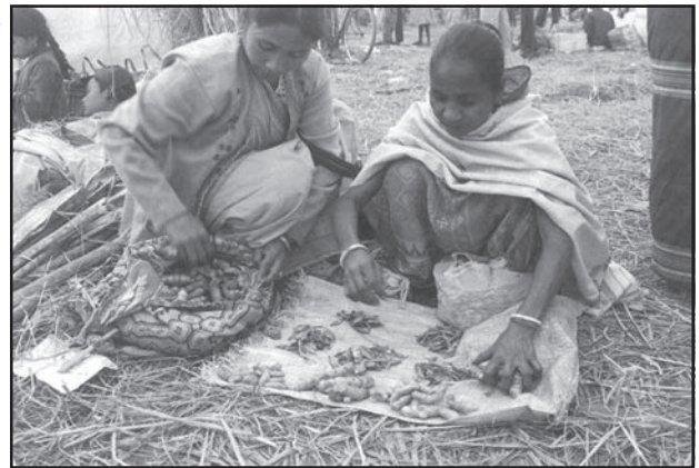
चित्र संख्या 8.1 : जॉन बीलमेला में वस्तुओं का आदान-प्रदान करती दो महिलाएँ

आदिम समाज में व्यापार का आरंभिक स्वरूप 'विनिमय व्यवस्था' था, जिसमें वस्तुओं का प्रत्यक्ष आदान-प्रदान होता था अर्थात् वस्तु के बदले में रुपये के स्थान पर वस्तु दी जाती थी। इस व्यवस्था में यदि आप एक कुम्हार होते और आपको एक नलसाज की आवश्यकता होती, तो आपको एक ऐसा नलसाज ढूँढना पड़ता, जिसे आप द्वारा बनाए हुए बर्तनों की आवश्यकता होती और आप उसकी नलसाज की सेवाओं के बदले अपने बर्तन देकर आदान-प्रदान कर सकते थे।