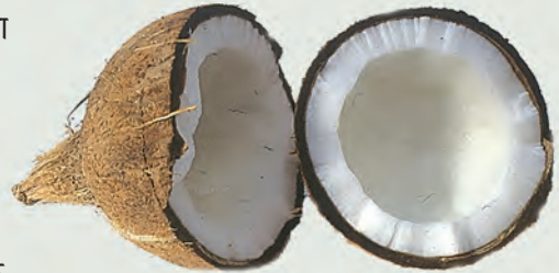
चित्र 5.1 (ख)

इस अध्याय में हम यह देखेंगे कि उपमहाद्वीप में आए यात्रियों द्वारा दिए गए सामाजिक जीवन के विवरणों के अध्ययन से किस प्रकार हम अपने अतीत के विषय में ज्ञान बढ़ा सकते हैं। इसके लिए हम तीन व्यक्तियों के वृत्तांतों पर ध्यान देंगे: अल-बिरूनी, जो ग्यारहवीं शताब्दी में उज्बेकिस्तान आया था, इब्न बतूता (चौदहवीं शताब्दी), मोरक्को से तथा फ्रांसीसी यात्री फ्रांस्वा बर्नियर (सत्रहवीं शताब्दी)।