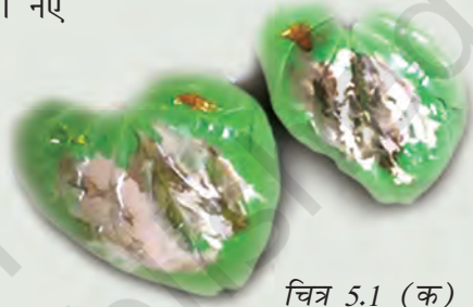
चित्र 5.1 (क) पान के पत्ते

महिलाओं और पुरुषों ने कार्य की तलाश में, प्राकृतिक आपदाओं से बचाव के लिए व्यापारियों, सैनिकों, पुरोहितों और तीर्थयात्रियों के रूप में या फिर साहस की भावना से प्रेरित होकर यात्राएँ की हैं। वे, जो किसी नए स्थान पर आते हैं अथवा बस जाते हैं, निश्चित रूप से एक ऐसी दुनिया को समझ पाते हैं जो भूदृश्य या भौतिक परिवेश के संदर्भ में और साथ ही लोगों की प्रथाओं, भाषाओं, आस्था तथा व्यवहार में भिन्न होती है। इनमें से कुछ इन भिन्नताओं के अनुरूप ढल जाते हैं और अन्य जो कुछ हद तक विशिष्ट होते हैं, इन्हें ध्यानपूर्वक अपने वृत्तांतों में लिख लेते हैं, जिनमें असामान्य तथा उल्लेखनीय बातों को अधिक महत्त्व दिया जाता है।