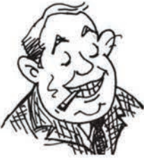
जनाब बिग ऑयल बिग ऑयल एंड संस के सीईओ

एक दिन मैंने खुद से पूछा कि आखिर मैं अपने मुल्क के किस काम आ सकता हूँ। मेरे मुल्क में तेल की भूख विकट है। वह कभी खत्म होने का नाम नहीं लेती, चलो, तो फिर तेल का इंतजाम करते हैं। मैं बाजार की आजादी का हामी हूँ। मतलब यह कि दूर के देशों में तेल के कुएँ खोदने की आजादी; धरती की आबो-हवा को मटियामेंट करने की आजादी और ऐसे कठपुतले तानाशाहों की ताजपोशी की आजादी जो अपनी ही जनता पर कोड़े फटकारे।