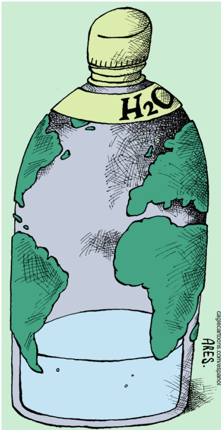
एरस, केगल्स कार्टून

पृथ्वी पर पानी का विस्तार ज़्यादा और भूमि का विस्तार कम है। फिर भी, कार्टून ने ज़मीन को पानी की अपेक्षा ज़्यादा बड़े हिस्से में दिखाने का फैसला किया है। यह कार्टून किस तरह पानी की कमी को चित्रित करता है?