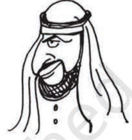
शेख पैट्रो डॉलर-उल्ला काला सोना मुल्क के सुल्तान

बेशकीमती चीजों की मैं कद्र करता हूँ बिग ऑयल कहते हैं कि उनके राष्ट्रपति आजादी और जम्हूरियत को बड़ा कीमती मानते हैं इसीलिए मैंने भी अपने मुल्क में आजादी और जम्हूरियत को सात तालों के भीतर बंद करके रखा है।