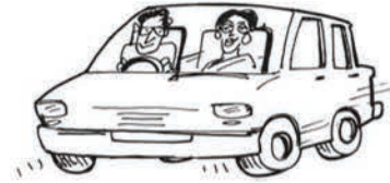
श्री एवं श्रीमती बड़बोले