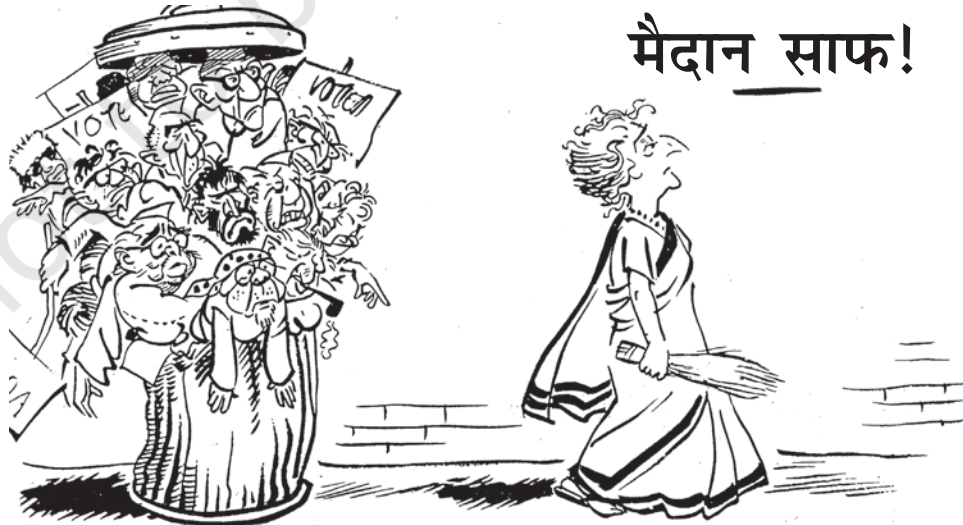
साभार: आर.के. लक्ष्मण, टाइम्स ऑफ़ इंडिया

यह कार्टून 1980 के चुनावों के बाद छपा था।