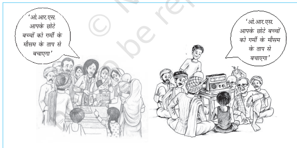
चित्र 6.3 आमने-सामने की अंतःक्रिया बनाम संचार-माध्यम का प्रसारण। कौन बेहतर कार्य करता है? क्यों?

● लक्ष्य की विशेषताएँ – लक्ष्य के गुण, जैसे अनुनयता (persuasibility) , प्रबल पूर्वाग्रह (strong prejudices) , आत्म-सम्मान (self-esteem) , और बुद्धि (intelligence) अभिवृत्ति परिवर्तन की संभावना एवं विस्तार को प्रभावित करते हैं। वे लोग जिनका व्यक्तित्व अधिक खुला एवं लचीला होता है, आसानी से परिवर्तित हो जाते हैं। विज्ञापनकर्ता ऐसे लोगों से अधिक लाभान्वित होते हैं। कम प्रबल पूर्वाग्रह वाले लोगों की तुलना में प्रबल पूर्वाग्रह रखने वाले अभिवृत्ति परिवर्तन के लिए कम प्रवण होते हैं। उच्च आत्म-सम्मान वालों की तुलना में वैसे लोग जिनमें आत्म-सम्मान की कमी होती है और जिनमें पर्याप्त आत्म-विश्वास नहीं होता है अपनी अभिवृत्तियों में आसानी से परिवर्तन कर लेते हैं। कम बुद्धि वाले लोगों की तुलना में अधिक बुद्धिमान व्यक्तियों में अभिवृत्ति परिवर्तन की संभावना कम होती है। हालाँकि, कभी-कभी अधिक बुद्धिमान व्यक्ति कम बुद्धि वाले व्यक्तियों