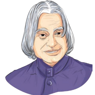
ए.पी.जे. अब्दुलः कलामः