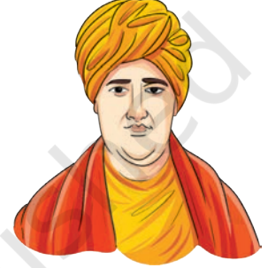
स्वामी दयानन्दः सरस्वती