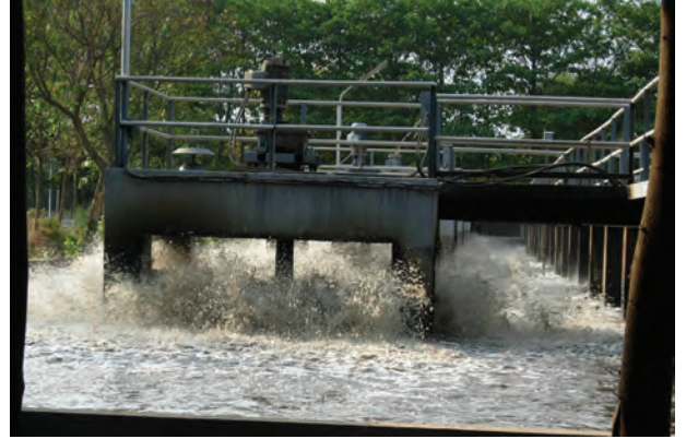
चित्र 13.6 वातित्र

कई घंटों के पश्चात् जल में निर्लंबित सूक्ष्मजीव टंकी की पेंदी में सक्रिय आपंक के रूप में बैठ जाते हैं। अब शीर्ष भाग से जल को निकाल दिया जाता है। सक्रिय आपंक लगभग 97% जल है। जल को बालू बिछाकर बनाए शुष्क तलों अथवा मशीनों द्वारा हटा दिया जाता है। शुष्क आपंक का उपयोग खाद के रूप में किया जाता है, जिससे कार्बनिक पदार्थ और पोषक तत्व पुनः मृदा में वापस चले जाते हैं।