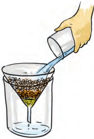
चित्र 13.2 वाहित द्रव को फ़िल्टर करने का प्रक्रम