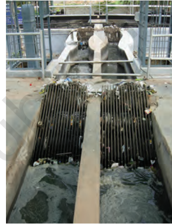
चित्र 13.3 शलाका छन्ने