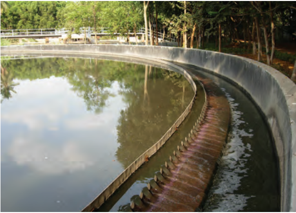
चित्र 13.5 जल अपमथित्र

आपंक को एक पृथक् टंकी में स्थानांतरित किया जाता है, जहाँ यह अवायवीय जीवाणुओं द्वारा अपघटित हो जाता है। इस प्रक्रम में उत्पन्न होने वाली बायोगैस (जैव गैस) का उपयोग ईंधन के रूप में अथवा विद्युत उत्पादन के लिए किया जा सकता है।