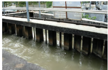
चित्र 13.4 ग्रिट और बालू अलग करने की टंकी