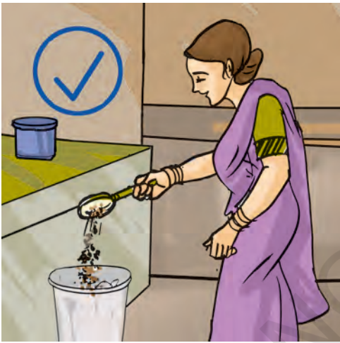
चित्र 13.7 हर कचरे को सिंक में मत फेंकिए

मल, स्वास्थ्य संकट का एक कारक है। इससे जल और मृदा का प्रदूषण हो सकता है। आप जानते हैं कि सतह पर उपलब्ध जल और भौमजल दोनों मानव मल से प्रदूषित हो जाते हैं। 'भौमजल' कुँओं, ट्यूबवेल (नलकूपों), झरनों और अनेक नदियों के लिए जल का स्रोत है। अतः अनुपचारित मानव मल, जल जनित रोगों का सबसे सुगम पथ बन जाता है। इनमें हैजा,