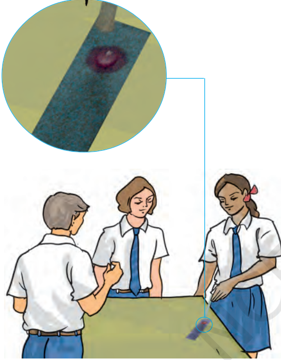
चित्र 4.2 लिटमस परीक्षण करते हुए बच्चे