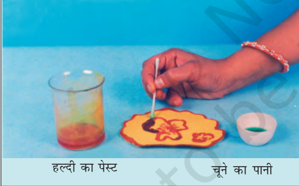
हल्दी का पेस्ट

आप अपनी माताजी के जन्मदिन पर, उनके लिए विशेष बधाई पत्र बना सकते हैं। सादे सफेद कागज़ की शीट पर हल्दी का पेस्ट लगाइए और उसे सुखा लीजिए। रुई के फाहे की सहायता से इस पर चूने के पानी से एक खूबसूरत फूल बनाइए। आपको एक सुंदर बधाई पत्र मिल जाएगा।