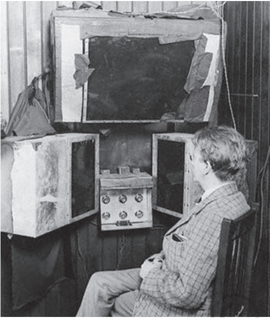
(यह यंत्र 'टेलीवाइजर', टेलीविजन का प्रारंभिक रूप था। अपने इस आविष्कार के सामने बैठे हैं— जॉन एल बेर्ड। इस यंत्र के द्वारा उन्होंने रॉयल इंस्टीट्यूट के समक्ष अपने आविष्कार का प्रदर्शन किया था।

अपने प्रिय टी.वी. कार्यक्रम के दौरान विज्ञापित होने वाली तीन चीजों की सूची बनाइए।