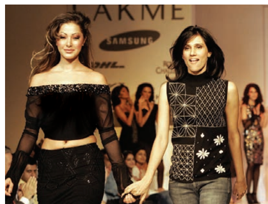
संचार माध्यमों में फैशन शो बहुत लोकप्रिय हुए हैं

कई बार ऐसी घटनाएँ हो जाती हैं, जब संचार माध्यम उन विषयों पर हमारा ध्यान केंद्रित कराने में असफल रहते हैं, जो हमारे जीवन के लिए महत्वपूर्ण हैं, उदाहरण के लिए — पीने का पानी हमारे देश की एक बड़ी समस्या है। प्रतिवर्ष हजारों लोग कष्ट सहते हैं और मर जाते हैं, क्योंकि उन्हें पीने के लिए सुरक्षित पानी नहीं मिलता, फिर भी संचार माध्यम हमें इस विषय पर बहुत कम ही चर्चा करते हुए दिखाते हैं। एक सुविख्यात भारतीय पत्रकार ने लिखा है कि कैसे वस्त्रों को नया रूपाकार देने वाले डिजाइनरों ने 'फैशन वीक' में धनवानों के समक्ष अपने नए वस्त्र प्रदर्शित करके सभी समाचारपत्रों के मुख्य पृष्ठ पर स्थान पा लिया, जबकि उसी सप्ताह मुंबई में अनेक झोपड़पट्टियों को गिरा दिया गया पर किसी ने इस पर ज़रा सा भी ध्यान नहीं दिया।