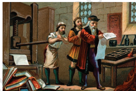
एक चित्रकार की नज़र में बाइबल के पहले पन्ने की छपाई करते हुए गुटेनबर्ग

पृष्ठ 64 पर दिए गए कोलाज में से संचार माध्यमों के छह अलग-अलग प्रकारों को छाँटिए।