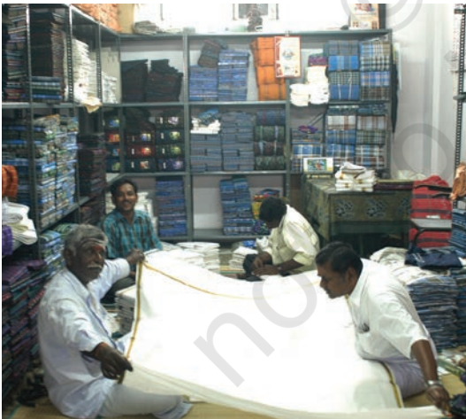
इरोड में एक दुकान

बाज़ार के दिनों में आपको वे बुनकर भी मिलेंगे, जो व्यापारियों के ऑर्डर के अनुसार कपड़ा बनाकर यहाँ लाते हैं। ये व्यापारी देश व विदेश के वस्त्र निर्माताओं और निर्यातकों को उनके ऑर्डर के अनुसार कपड़ा उपलब्ध कराते हैं। ये सूत खरीदते हैं और बुनकरों को निर्देश देते हैं कि किस प्रकार का कपड़ा तैयार किया जाना है। निम्नलिखित उदाहरण में हम देखेंगे कि यह कार्य कैसे होता है।