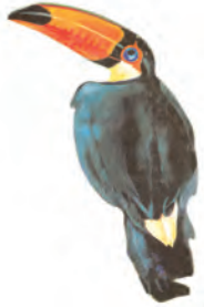
चित्र 6.4 : टूकन

इन प्रदेशों में अत्यधिक वर्षा के कारण यहाँ की भूमि पर सघन वन उग जाते हैं (चित्र 6.3)। वन इतने सघन होते हैं कि पत्तियों तथा शाखाओं से 'छत' सी बन जाती है जिसके कारण सूर्य का प्रकाश धरातल तक नहीं पहुँच पाता है। यहाँ की भूमि प्रकाश रहित एवं नम बनी रहती है। यहाँ केवल वही वनस्पति पनप सकती है जिसमें छाया में बढ़ने की क्षमता हो। परजीवी पौधों के रूप में यहाँ आर्किड एवं ब्रोमिलायड पैदा होते हैं।