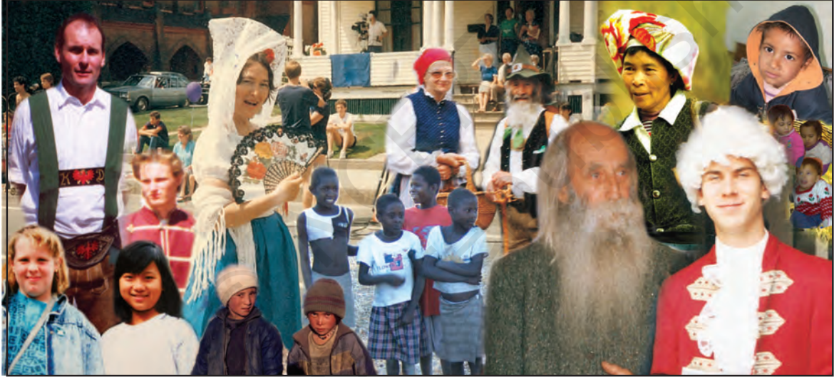
चित्र 6.1 : विश्व के विभिन्न भागों के निवासी

रेणुका बहुत उत्साहित थी। उसके चाचा श्रीकांत लगभग चार महीने के बाद आज घर में थे। वह एक वन्यजीव फोटोग्राफर थे तथा बहुत यात्रा करते थे। बहुत छोटी उम्र से ही रेणुका की रुचि वन्यजीव एवं वनों में थी जब उसके चाचा ने प्रकृति संबंधी पुस्तकों से उसका परिचय कराया। दूरस्थ भूस्थल एवं वहाँ रहने वाले लोगों की तसवीरें उसे हमेशा आकर्षित करती थी।