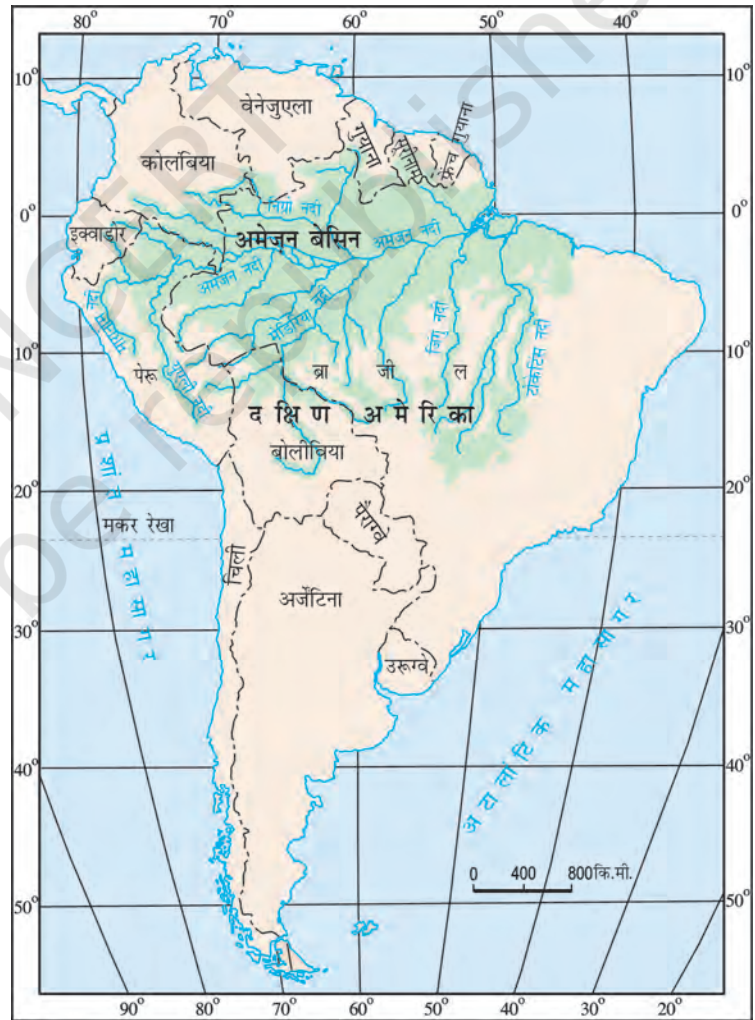
चित्र 6.2 : दक्षिण अमेरिका में अमेज़न बेसिन

क्या आप इस बेसिन में स्थित उन देशों के नाम बता सकते हैं जिनसे भूमध्य रेखा गुजरती है?