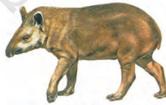
चित्र 6.5 : टैपीर

'ब्रोमिलायड' एक विशेष प्रकार का पौधा है जो अपनी पत्तियों में जल को संचित रखता है। मेढ़क जैसे प्राणी इन जल के पॉकेट का उपयोग अंडा देने के लिए करते हैं।