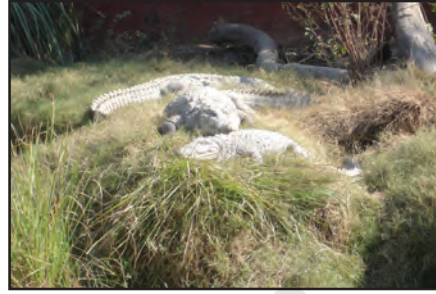
चित्र 6.12 : मगर