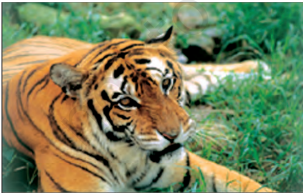
चित्र 6.14 : मानस वन्य प्राणी अभयवन में बाघ

बेसिन में यातायात का सुविकसित तंत्र उपस्थित है। आप देख सकते हैं कि गंगा-ब्रह्मपुत्र बेसिन में यातायात के चार मार्ग सुविकसित हैं। मैदानी इलाकों के लोग सड़कमार्ग एवं रेलमार्ग द्वारा एक स्थान से दूसरे स्थान तक जाते हैं। नदी के तटीय क्षेत्रों में जलमार्ग यातायात का प्रभावशाली माध्यम है। कोलकाता हुगली नदी पर स्थित एक महत्वपूर्ण पत्तन है। मैदानी क्षेत्र में कई बड़े हवाई पत्तन भी स्थित हैं।