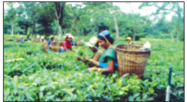
चित्र 6.10 : असम में चाय बागान