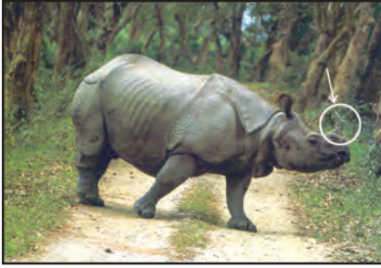
चित्र 6.11 : एक सींग वाला गैंडा

बेसिन में विविध प्रकार के वन्यजीव पाए जाते हैं। इनमें हाथी, बाघ, हिरण एवं बंदर आदि सामान्य रूप से पाए जाने वाले जीव हैं। एक सींग वाला गैंडा ब्रह्मपुत्र के मैदानों में पाया जाता है (चित्र 6.11)। डेल्टा क्षेत्र में बंगाल टाइगर एवं मगर पाए जाते हैं (चित्र 6.12)। नदी के साफ़ जल, झील एवं बंगाल की खाड़ी में प्रचुर मात्रा में जलीय जीव पाए जाते हैं। रोहू, कतला एवं हिलसा मछलियों की सबसे लोकप्रिय प्रजातियाँ हैं। मछली एवं चावल इस क्षेत्र में रहने वाले लोगों का मुख्य आहार है।