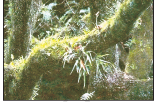
चित्र 6.3 : अमेज़न वन

यहाँ के लोग छोटे-से क्षेत्र में वन के कुछ वृक्षों को काटकर अपने भोजन के लिए फसल उगाते हैं। यहाँ के पुरुष शिकार करते हैं तथा नदी में मछली पकड़ते हैं जबकि