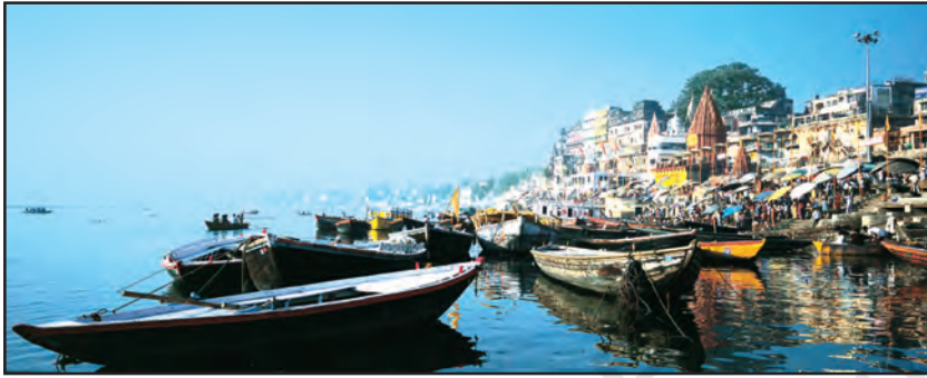
चित्र 6.13 : गंगा नदी के तट पर स्थित वाराणसी शहर

गंगा-ब्रह्मपुत्र के मैदानों में कई बड़े शहर एवं कस्बे स्थित हैं। इलाहाबाद, कानपुर, वाराणसी, लखनऊ, पटना एवं कोलकाता जैसे 10 लाख से अधिक आबादी वाले शहर गंगा नदी के तट पर ही स्थित हैं (चित्र 6.13)। इन शहरों तथा यहाँ स्थित उद्योगों का गंदा पानी बहकर नदी में ही जाता है जिससे नदी प्रदूषित होती है।