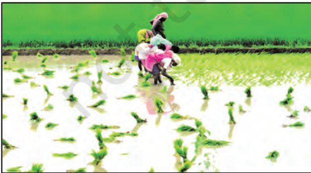
चित्र 6.9 : धान की कृषि

विभिन्न भू-आकृतियों के अनुसार वनस्पति में भी विभिन्नता पायी जाती है। गंगा-ब्रह्मपुत्र के मैदानों में सागवान, साखू एवं पीपल के साथ उष्णकटिबंधीय पर्णपाती पेड़ भी पाए जाते हैं। ब्रह्मपुत्र के मैदानी क्षेत्रों में घने बाँस के घने झुरमुट पाए जाते हैं। डेल्टा क्षेत्र में ग्रीव वन से घिरा है। उत्तराखंड, सिक्किम एवं अरुणाचल प्रदेश की ठंडी जलवायु एवं तीव्र ढाल वाले भागों में चीड़, देवदार एवं फर जैसे शंकुधारी पेड़ पाए जाते हैं।