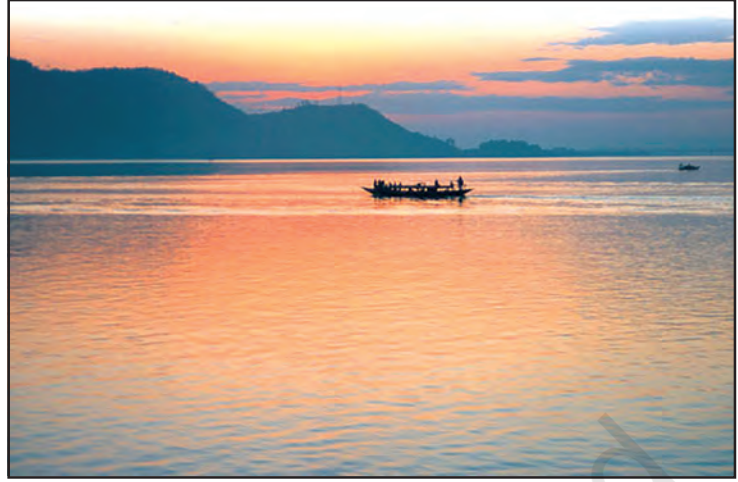
चित्र 6.7 : ब्रह्मपुत्र नदी

गंगा एवं ब्रह्मपुत्र के मैदान, पर्वत एवं हिमालय के गिरिपाद तथा सुंदरवन डेल्टा