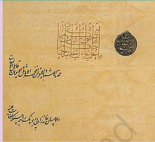
चित्र 7 नूरजहाँ का फ़रमान

बाईं ओर दिया गया दस्तावेज़, नूरजहाँ द्वारा जारी किया गया आदेश (फ़रमान) है। चौकोर मोहर बताती है— 'उदात्त और महान महारानी नूरजहाँ पादशाह बेगम का आदेश'। गोल मोहर के अनुसार, 'शाह जहाँगीर के प्रताप से महारानी, चन्द्रमा जैसी वैभवशाली बन गई: हम कामना करते हैं कि नूरजहाँ पादशाह इस युग की सर्वोत्तम महिला बने'