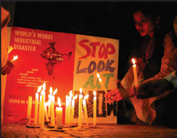
इंसाफ़ की लड़ाई अभी जारी है...।

24 साल बाद भी लोग न्याय के लिए संघर्ष कर रहे हैं। वे पीने के साफ़ पानी, स्वास्थ्य सुविधाओं और यूनिन कार्बाइड के जहर से ग्रस्त लोगों के लिए नौकरियों की माँग कर रहे हैं। उन्होंने यूनिन कार्बाइड के चेयरमैन एंडरसन को सज़ा दिलाने के लिए भी आंदोलन चलाया है।