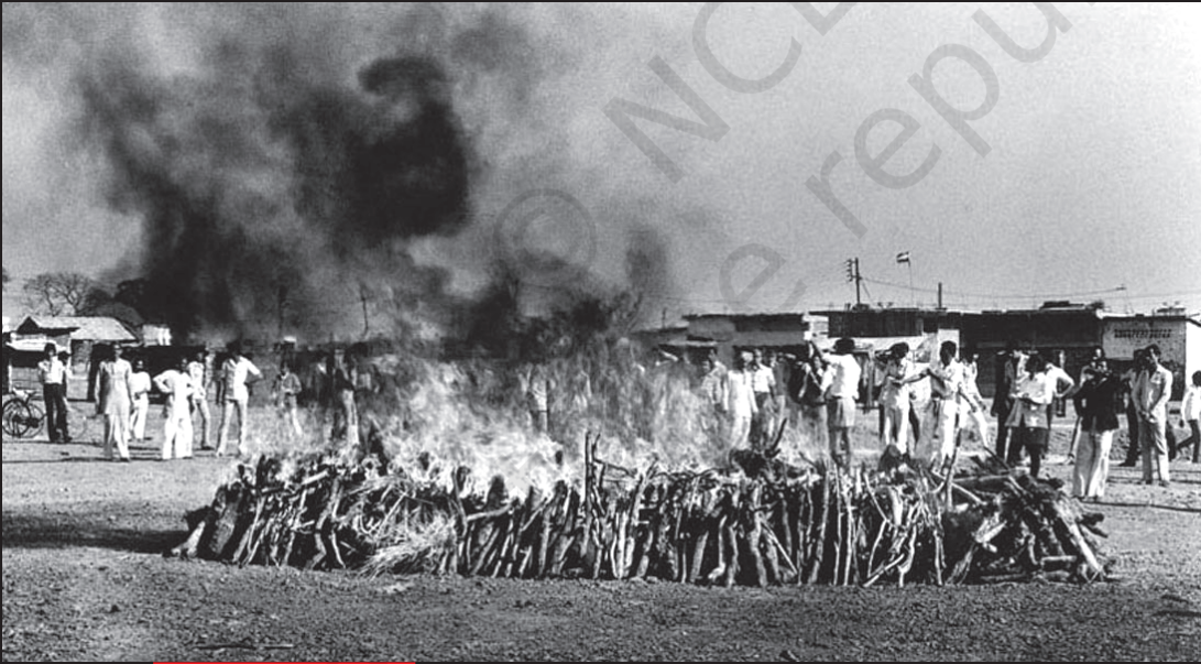
सामूहिक अंतिम संस्कार

तीन दिन के भीतर 8,000 से ज़्यादा लोग मौत के मुँह में चले गए। लाखों लोग गंभीर रूप से प्रभावित हुए।