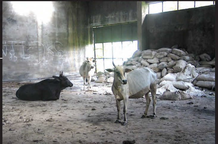
यूनिन कार्बाइड संयंत्र के इर्द-गिर्द बिखरे पड़े रसायनों के बोरे

यूनिन कार्बाइड ने कारखाना तो बंद कर दिया, लेकिन भारी मात्रा में विषैले रसायन वहीं छोड़ दिए। ये रसायन रिस-रिस कर ज़मीन में जा रहे हैं जिससे वहाँ का पानी दूषित हो रहा है। अब यह संयंत्र डाओ कैमिकल नामक कंपनी के कब्जे में है जो इसकी साफ़-सफ़ाई का जिम्मा उठाने को तैयार नहीं है।