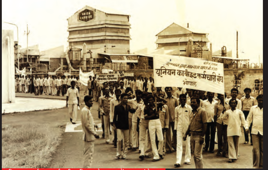
यूनिन कार्बाइड कर्मचारी यूनिन के सदस्यों का आंदोलन

यह तबाही कोई दुर्घटना नहीं थी। यूनिन कार्बाइड ने पैसा बचाने के लिए सुरक्षा उपार्यों को जानबूझकर नजरअंदाज किया था। 2 दिसंबर की त्रासदी से बहुत पहले भी कारखाने में गैस का रिसाव हो चुका था। इन घटनाओं में एक मजदूर की मौत हुई थी जबकि बहुत सारे घायल हुए थे।