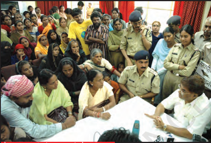
गैस राहत मंत्री से बात करते गैस पीड़ित।

सबूतों से पूरी तरह साफ़ था कि इस महाविनाश के लिए यूनिन कार्बाइड ही दोषी है, लेकिन कंपनी ने अपनी गलती मानने से इनकार कर दिया।