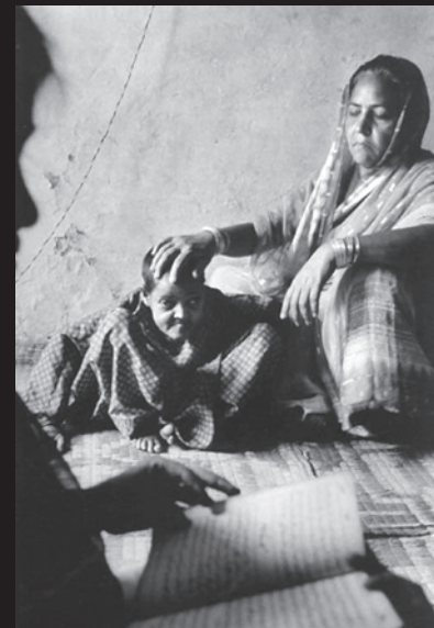
गैस से बुरी तरह प्रभावित एक बच्चा

जहरीली गैस के संपर्क में आने वाले ज़्यादातर लोग गरीब कामकाजी परिवारों के लोग थे। उनमें से लगभग 50,000 लोग आज भी इतने बीमार हैं कि कुछ काम नहीं कर सकते। जो लोग इस गैस के असर में आने के बावजूद जिंदा रह गए उनमें से बहुत सारे लोग गंभीर श्वास विकारों, आँख की बीमारियों और अन्य समस्याओं से पीड़ित हैं। बच्चों में अजीबो-गरीब विकृतियाँ पैदा हो रही हैं। इस चित्र में दिखाई दे रही लड़की इस बात का उदाहरण है।