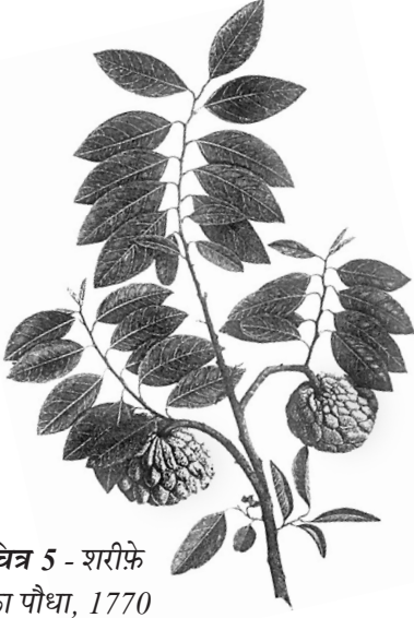
चित्र 5 - शरीफे का पौधा, 1770 का दशक।

अंग्रेजों द्वारा बनाए गए वानस्पतिक उद्यान और प्राकृतिक इतिहास के संग्रहालयों में विभिन्न पौधों के नमूने और उनसे संबंधित जानकारीयाँ इकट्ठा की जाती थीं। इन नमूनों के चित्र स्थानीय कलाकारों से बनवाए जाते थे। अब इतिहासकार इस बात पर ध्यान दे रहे हैं कि इस तरह की जानकारी किस तरह इकट्ठा की जाती थी और इससे उपनिवेशवाद के बारे में क्या पता चलता है।