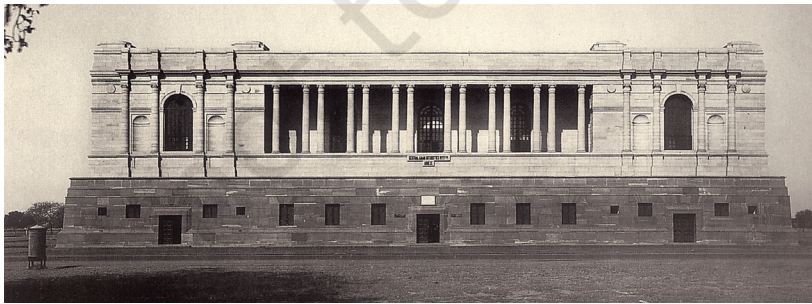
चित्र 4 - भारतीय राष्ट्रीय अभिलेखागार 1920 के दशक में बनाया गया।

उन्नीसवीं सदी की शुरुआत में प्रशासन की एक शाखा से दूसरी शाखा के पास भेजे गए पत्रों और ज्ञापनों को आप आज भी अभिलेखागारों में देख सकते हैं। वहाँ आप ज़िला अधिकारियों द्वारा तैयार किए गए नोट्स और रिपोर्ट पढ़ सकते हैं या ऊपर बैठे अफ़सरों द्वारा प्रांतीय अधिकारियों को भेजे गए निर्देश और सुझाव देख सकते हैं। उन्नीसवीं सदी के शुरुआती सालों में इन दस्तावेजों की सावधानीपूर्वक नकलें बनाई जाती थीं।