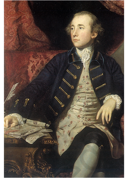
चित्र 3 - वॉरेन हेस्टिंग्स 1773 में पहले गवर्नर-जनरल बने।

मिल को लगता था कि सारे एशियाई समाज सभ्यता के मामले में यूरोप से पीछे हैं। इतिहास की उनकी समझदारी ये थी कि भारत में अंग्रेजों के आने से पहले यहाँ हिंदू और मुसलमान तानाशाहों का ही राज चलता था। यहाँ चारों ओर केवल धार्मिक बैर, जातिगत बंधनों और अंधविश्वासों का ही बोलबाला था।