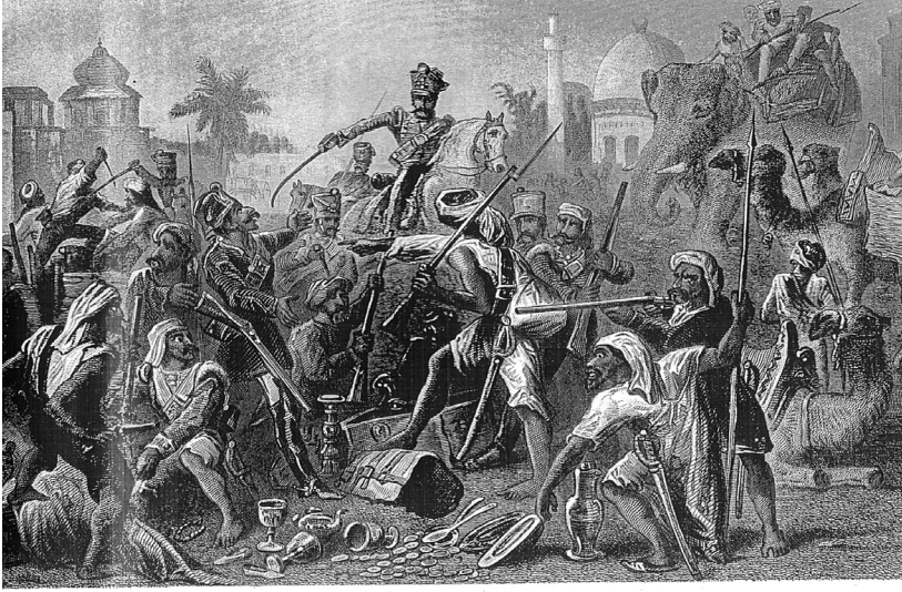
चित्र 7 - 1857 के विद्रोही।

तसवीरों को भी बहुत ध्यान से देखना चाहिए। उनसे हमें चित्रकार की सोच पता चलती है। 1857 के विद्रोह के बाद अंग्रेजों द्वारा तैयार की गई सचित्र पुस्तकों में यह तसवीर कई जगह दिखाई देती है। इस तसवीर के नीचे लिखा होता था — “बागी सिपाही लूट-खसोट में लगे हुए हैं”। अंग्रेजों की नजर में विद्रोही जनता लालची, दुष्ट और बेरहम थी। इस विद्रोह के बारे में आप अध्याय 5 में पढ़ेंगे।