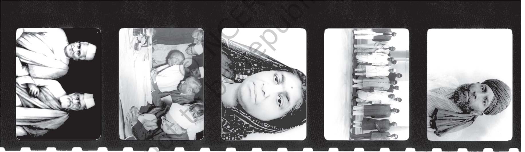
नेहरू मेमोरियल म्यूजियम एवं लाइब्रेरी, नई दिल्ली