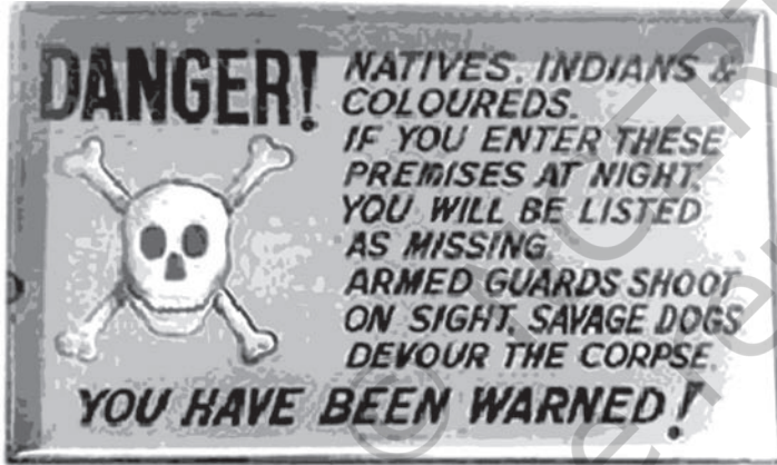
साउथ अफ्रीका हिस्ट्री ऑनलाइन

1950 से ही अश्वेत, रंगीन चमड़ी वाले और भारतीय मूल के लोगों ने रंगभेद प्रणाली के खिलाफ संघर्ष किया। उन्होंने विरोध प्रदर्शन किए और हड़तालें आयोजित कीं। भेदभाव वाली इस शासन प्रणाली का विरोध करने वाले संगठन अफ्रीकी नेशनल कांग्रेस के इंडे तले एकजुट