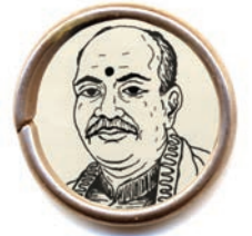
श्यामा प्रसाद मुखर्जी

(1887-1971), जन्म: गुजरात। वकील, इतिहासकार और भाषाविद्। कांग्रेसी नेता और गांधीवादी। बाद में: केंद्रीय मंत्रिमंडल में मंत्री। स्वतंत्र पार्टी के संस्थापक।