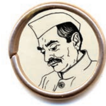
राजेंद्र प्रसाद (1884-1963), जन्म: बिहार। संविधान सभा के अध्यक्ष। वकील और चंपारण सत्याग्रह के प्रमुख भागीदार। तीन बार कांग्रेस अध्यक्ष। बाद में: भारत के प्रथम राष्ट्रपति।