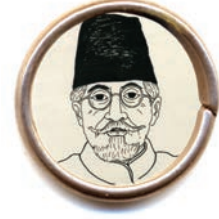
अबुल कलाम आज़ाद (1888-1958), जन्म: सऊदी अरब। शिक्षाविद्, लेखक और धर्मशास्त्रों के ज्ञाता; अरबी के विद्वान। कांग्रेसी नेता, राष्ट्रीय आंदोलन में अग्रणी भूमिका। मुस्लिम अलगाववादी राजनीति के विरोधी। बाद में: पहले केंद्रीय मंत्रिमंडल में शिक्षा मंत्री।

चुने गए जनप्रतिनिधियों की जो सभा संविधान नामक विशाल दस्तावेज़ को लिखने का काम करती है उसे संविधान सभा कहते हैं। भारतीय संविधान सभा के लिए जुलाई 1946 में चुनाव हुए थे। संविधान सभा की पहली बैठक दिसंबर 1946 को हुई थी। इसके तत्काल बाद देश दो हिस्सों-भारत और पाकिस्तान-में बँट गया। संविधान सभा भी दो हिस्सों में बँट गई- भारत की संविधान सभा और पाकिस्तान की