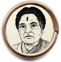
जी. दुर्गाबाई देशमुख (1909-1981), जन्म: आंध्र प्रदेश। वकील और महिला मुक्ति कार्यकर्ता। आंध्र महिला सभा की संस्थापक। कांग्रेस की सक्रिय नेता। बाद में: केंद्रीय समाज कल्याण बोर्ड की संस्थापक अध्यक्ष।