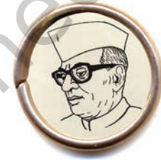
कन्हैयालाल माणिकलाल मुंशी

(1901-1961), जन्म: हरियाणा। सफल उद्यमी और पंजाब विधानसभा में पंथक अकाली पार्टी के नेता। संविधान सभा में कांग्रेस द्वारा मनोनीत। बाद में: केंद्रीय मंत्रिमंडल में रक्षा मंत्री।