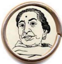
सरोजिनी नायडू (1879-1949) जन्म: आंध्र प्रदेश। कवयित्री, लेखिका और राजनैतिक कार्यकर्ता। कांग्रेस की अग्रणी महिला नेता। बाद में: उत्तर प्रदेश की राज्यपाल