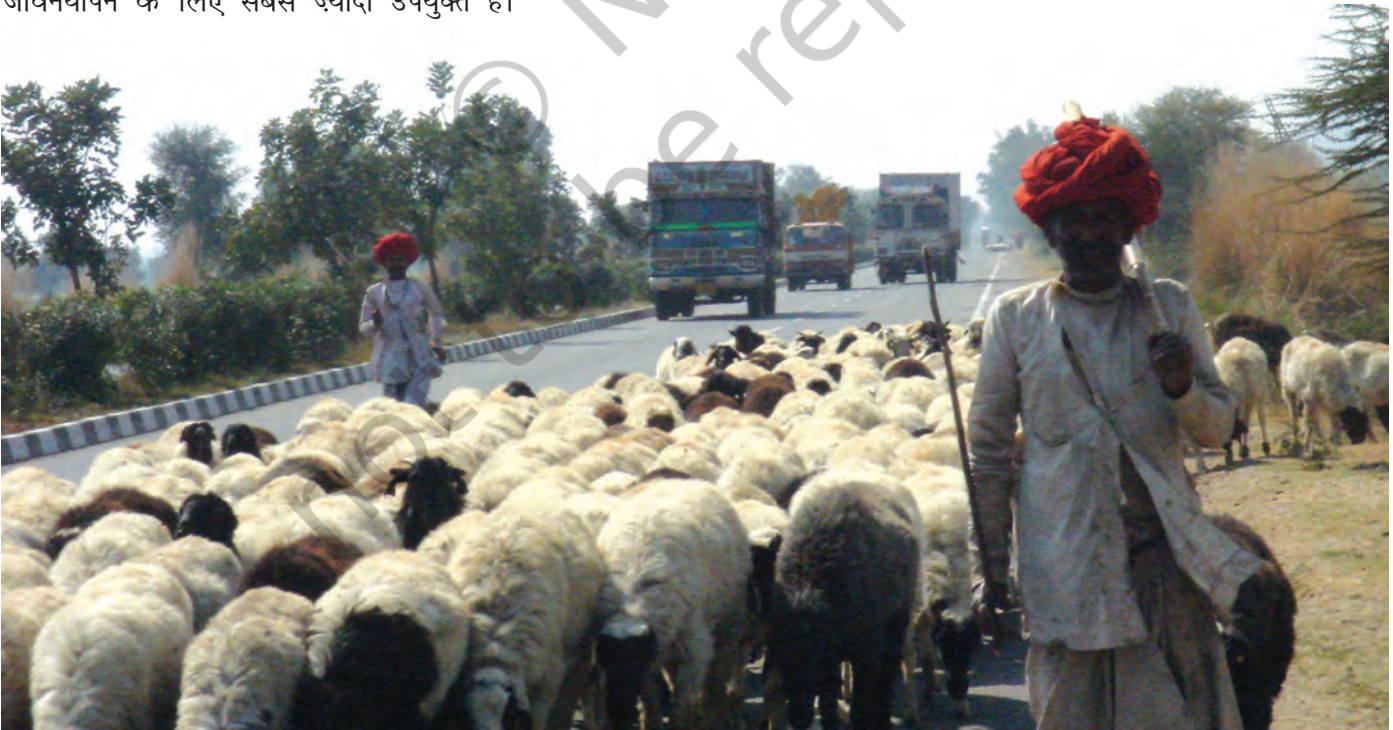
चित्र 18 - जयपुर राजमार्ग पर राइका गड़रिये.

चरवाहे अतीत के अवशेष नहीं हैं। वे ऐसे लोग नहीं हैं जिनके लिए आज की आधुनिक दुनिया में कोई जगह नहीं है। पर्यावरणवादी और अर्थशास्त्री अब इस बात को काफ़ी गंभीरता से मानने लगे हैं कि घुमंतू चरवाहों की जीवनशैली दुनिया के बहुत सारे पहाड़ी और सूखे इलाकों में जीवनयापन के लिए सबसे ज्यादा उपयुक्त है।