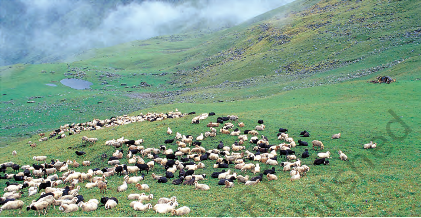
चित्र 1 - पूर्वी गढ़वाल के बुग्याल में चरती भेड़ें.

बुग्याल ऊँचे पहाड़ों पर 12,000 फुट से भी ज्यादा ऊँचाई पर स्थित विशाल प्राकृतिक चरागाह होते हैं। जाड़ों में ये बर्फ से ढके रहते हैं और अप्रैल के बाद हरे-भरे हो जाते हैं। इस समय पहाड़ियों की तलहटी तरह-तरह की घास, जड़ों और जड़ी-बूटियों से भरी रहती है। मॉनसून तक इन चरागाहों में घनी हरियाली छा जाती है और चारों तरफ फूल ही फूल दिखाई देने लगते हैं।