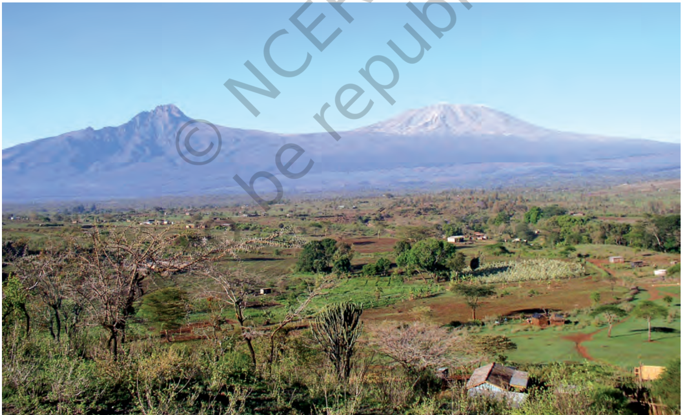
चित्र 12 - मासाई लैंड जिसके पीछे किलिमंजारो पहाड़ दिखाई दे रहे हैं।

हिंदुस्तान की तरह अफ्रीकी चरवाहों की ज़िंदगी में भी औपनिवेशिक और उत्तर-औपनिवेशिक काल में गहरे बदलाव आए हैं। आखिर क्या थे ये बदलाव?