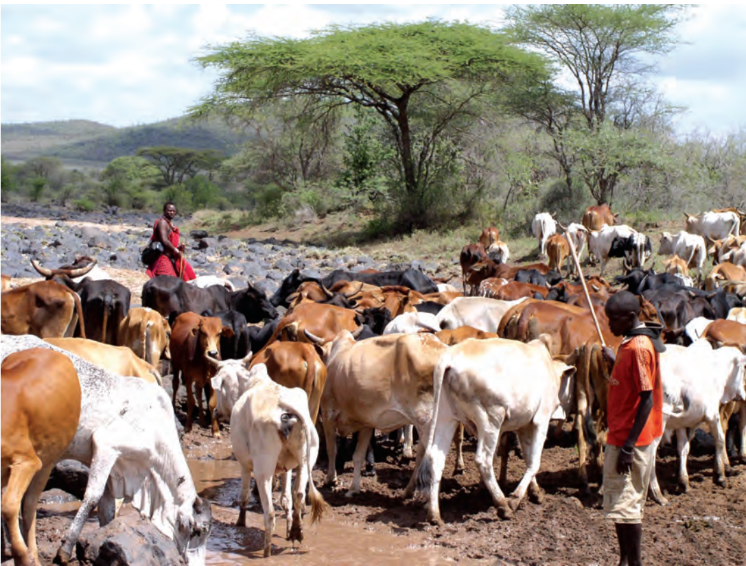
चित्र 15 - मासाई नाम 'मा' शब्द से निकला है। मा-साई का मतलब होता है 'मेरे लोग'। परंपरागत रूप से मासाई घुमंतू और चरवाहा समुदाय के लोग होते हैं जो अपनी आजीविका के लिए दूध और मांस पर आश्रित रहते हैं। ऊँचे तापमान और कम वर्षा के कारण यहाँ शुष्क, धूल भरे और बेहद गर्म हालात रहते हैं। इस अर्ध-शुष्क विषुववृत्तीय इलाके में सूखे के हालात सामान्य हैं। ऐसे समय में बहुत सारे जानवर मर जाते हैं।