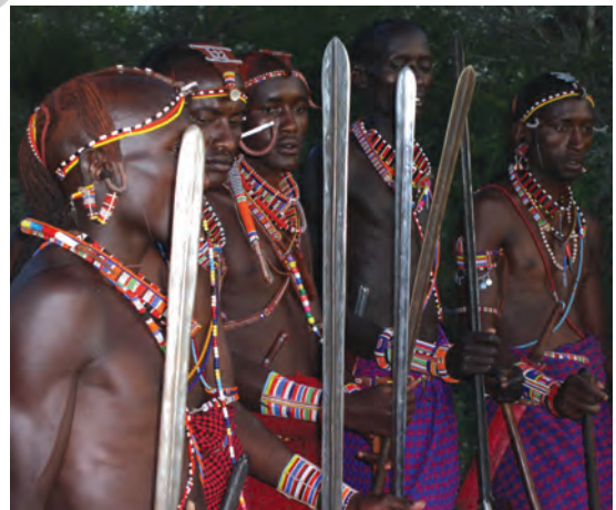
चित्र 16 - योद्धा गहरे लाल रंग की शुका और चमकदार मोतियों के आभूषण पहनते हैं तथा स्टील की नोक वाला पाँच फुट लंबा भाला रखते हैं। बारीकी से सँवारे गए उनके बाल गेरू से रंगे होते हैं। उगते सूरज को सम्मान देने के लिए वे पूर्व की ओर मुँह करके खड़े होते हैं। योद्धा अपने समुदाय की रक्षा करते हैं और लड़के पशुओं को चराते हैं। सूखे के मौसम में योद्धा और लड़के, दोनों ही पशु चराते हैं।

औपनिवेशिक काल में अफ्रीका के बाकी स्थानों की तरह मासाइलैंड में भी आए बदलावों से सारे चरवाहों पर एक जैसा असर नहीं पड़ा। उपनिवेश बनने से पहले मासाई समाज दो सामाजिक श्रेणियों में बँटा हुआ था – वरिष्ठ जन (एल्डर्स) और योद्धा (वॉरियर्स)। वरिष्ठ जन शासन चलाते थे। समुदाय से जुड़े मामलों पर विचार-विमर्श करने और अहम फैसले लेने के लिए वे समय-समय पर सभा करते थे। योद्धाओं में ज्यादातर नौजवान होते थे जिन्हें मुख्य रूप से लड़ाई लड़ने और कबीले की हिफाजत करने के लिए तैयार किया जाता था। वे समुदाय की रक्षा करते थे और दूसरे कबीलों के मवेशी छीन कर लाते थे। जहाँ जानवर ही संपत्ति हो वहाँ हमला करके दूसरों के जानवर छीन लेना एक महत्वपूर्ण काम होता था। अलग-अलग चरवाहा समुदायों की ताकत इन्हीं हमलों से तय होती थी। युवाओं को योद्धा वर्ग का हिस्सा तभी माना जाता था जब वे दूसरे समूह के मवेशियों को छीन कर और