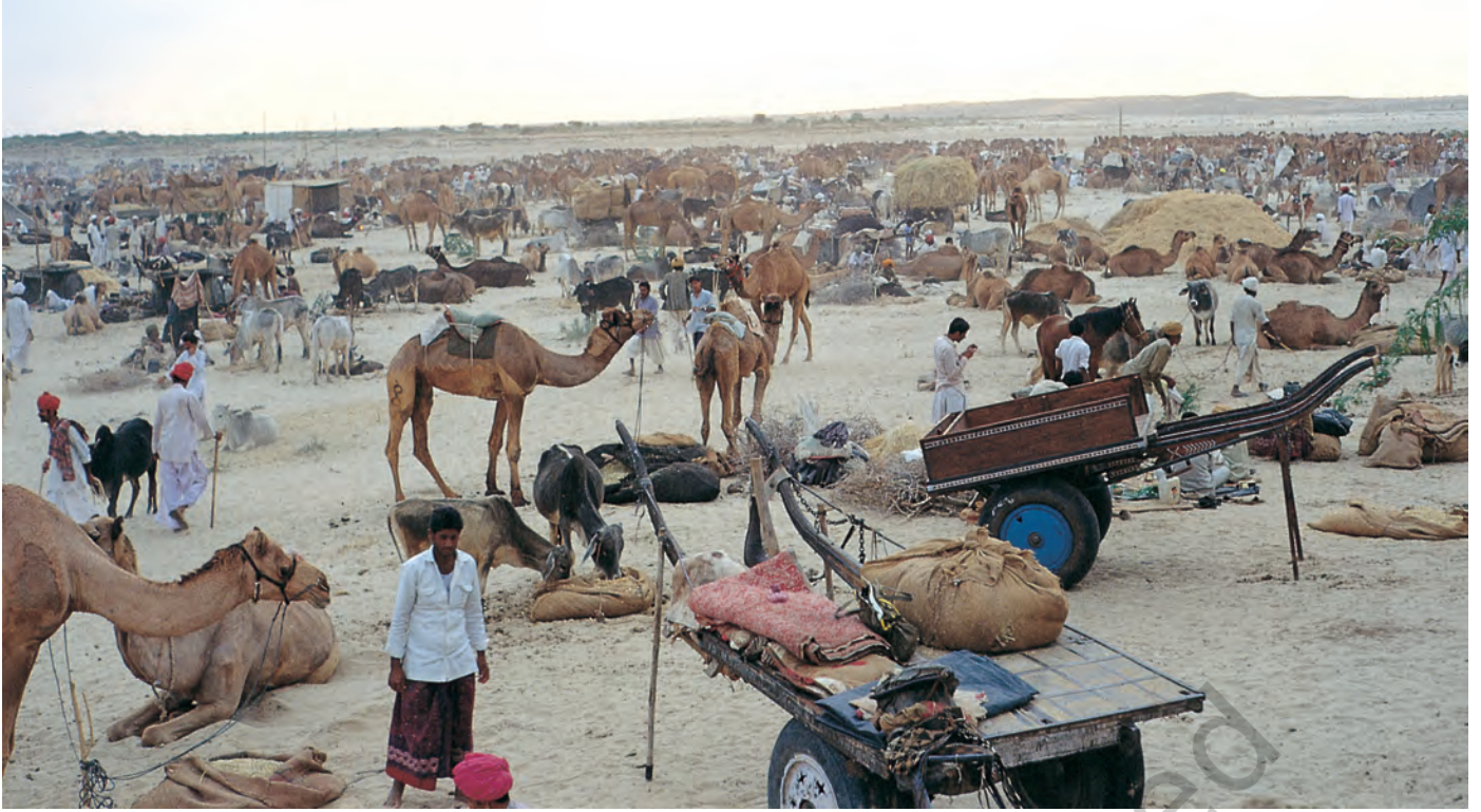
चित्र 7 - पश्चिमी राजस्थान में बलोतरा स्थित ऊँट मेला.

ऊँटपालक यहाँ ऊँटों की खरीद-फ़रोखा के लिए आते हैं। मेले में मारू राइका ऊँटों के प्रशिक्षण में अपनी महारत का भी प्रदर्शन करते हैं। इस मेले में गुजरात से घोड़े भी लाए जाते हैं।