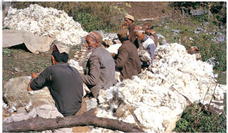
चित्र 4 - गद्दी भेड़ों की ऊन उतार रहे हैं।

भाबर : गढ़वाल और कुमाऊँ के इलाके में पहाड़ियों के निचले हिस्से के आसपास पाए जाने वाला शुष्क या सूखे जंगल का इलाका। बुयाल : ऊँचे पहाड़ों में स्थित घास के मैदान।