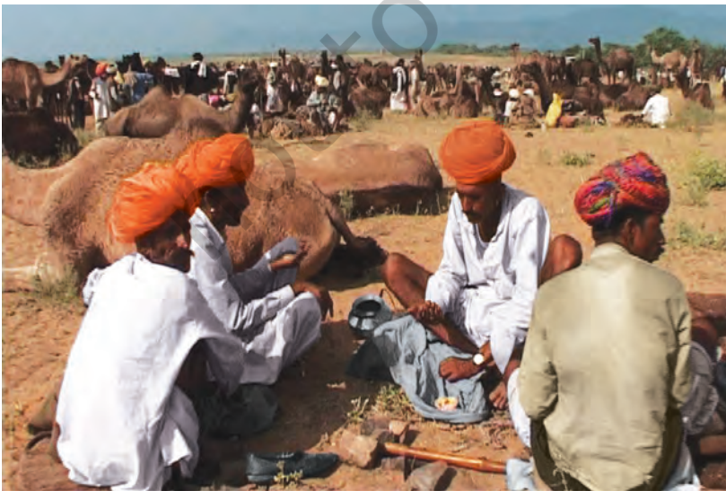
चित्र 8 - पुष्कर का ऊँट मेला.

आइए, अब देखें कि औपनिवेशिक शासन के दौरान यानी अंग्रेज़ों के ज़माने में चरवाहों का जीवन किस तरह बदला?