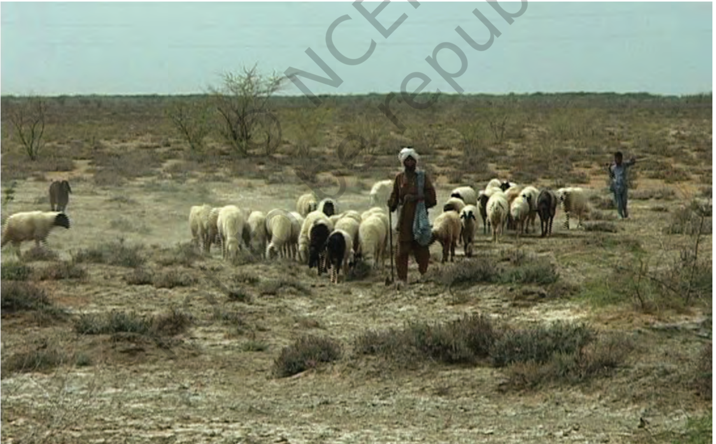
चित्र 10 - चरागाहों की तलाश में निकले मालधारी चरवाहे। उनके गाँव कच्छ की रन में स्थित हैं।

वंशावली बताने वाला समुदाय का इतिहास बताता है। इस तरह की मौखिक परंपराओं से चरवाहा समुदायों को अपनी पहचान का भाव मिलता है। इन परंपराओं से हम यह पता लगा सकते हैं कि कोई समूह अपने अतीत को किस तरह देखता है।