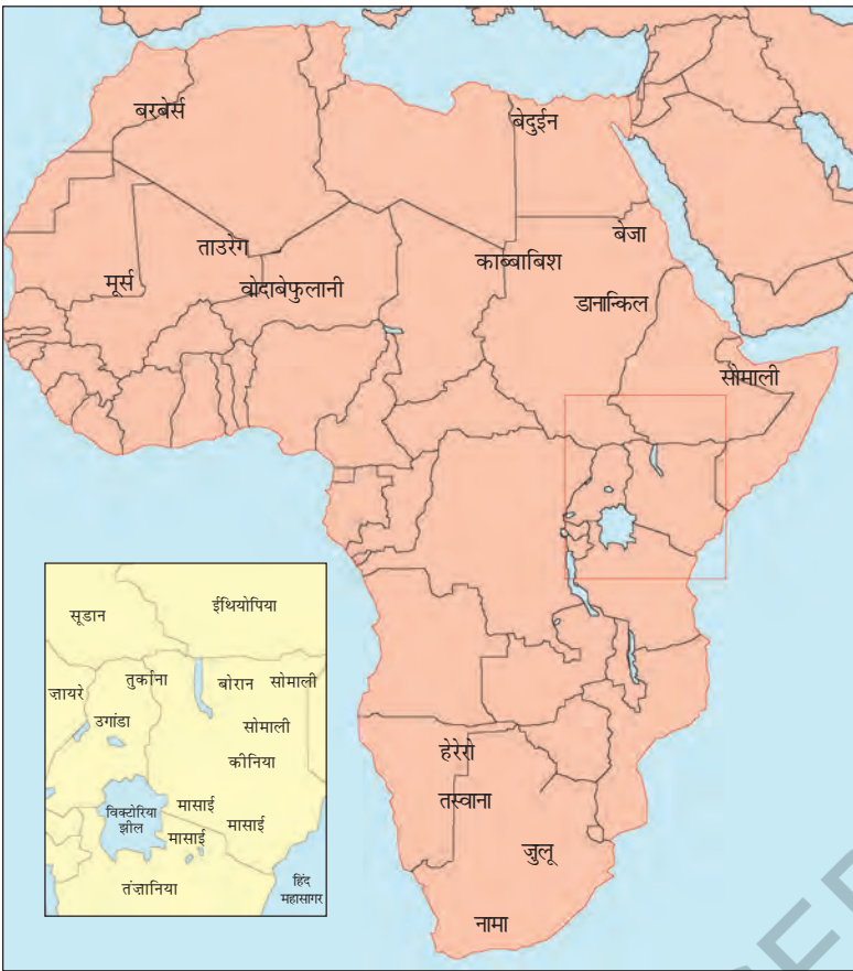
चित्र 13 - अफ्रीका के चरवाहा समुदाय.

छोटी तस्वीर (इनसेट) में कीनिया और तंजानिया में मासाइयों का इलाका दर्शाया गया है।