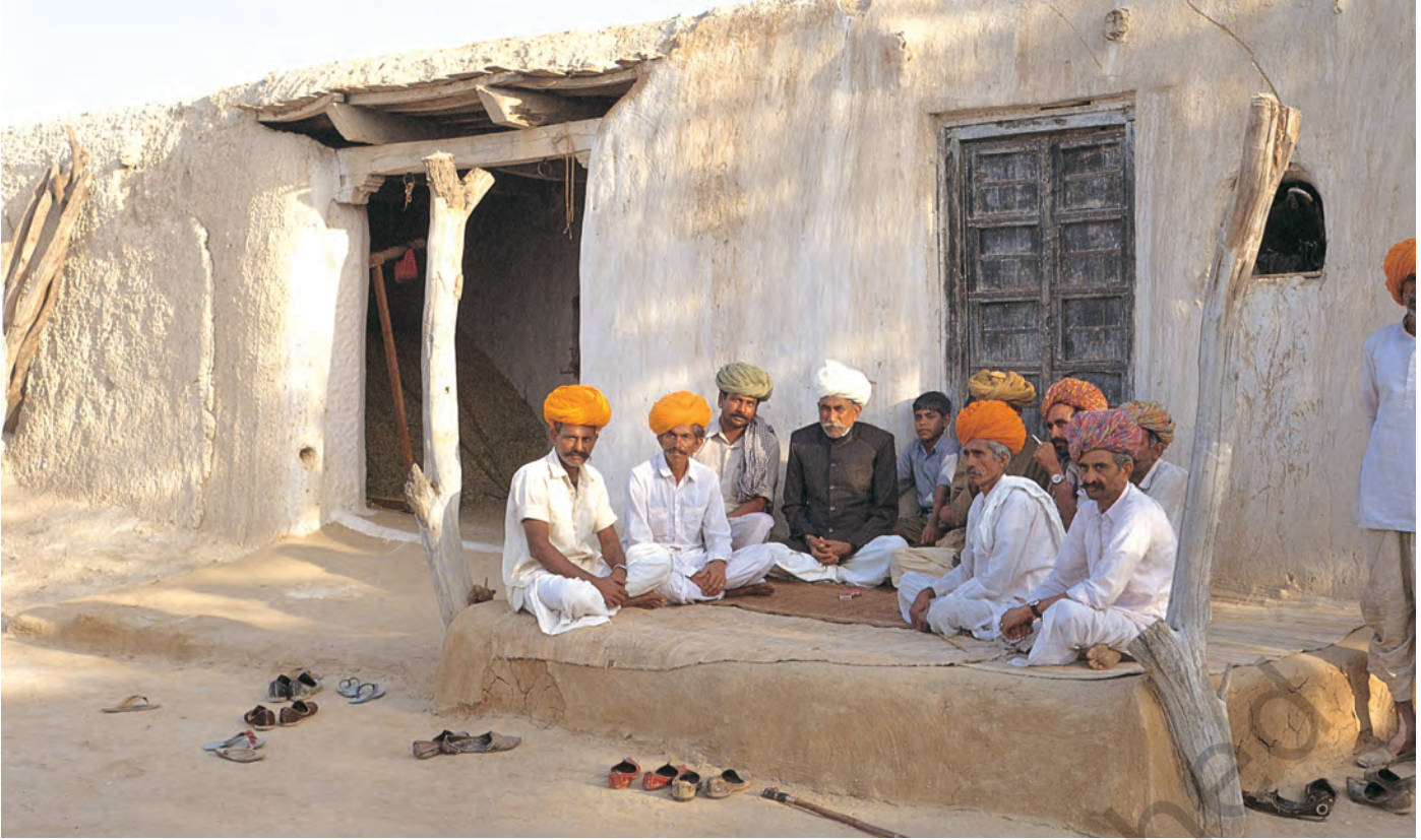
चित्र 9 - मारू राइकाओं की वंशावली बताने वाला.

वंशावली बताने वाला समुदाय का इतिहास बताता है। इस तरह की मौखिक परंपराओं से चरवाहा समुदायों को अपनी पहचान का भाव मिलता है। इन परंपराओं से हम यह पता लगा सकते हैं कि कोई समूह अपने अतीत को किस तरह देखता है।