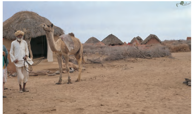
चित्र 6 - अपने ऊँट के साथ एक ऊँटपालक.

यह राजस्थान में जैसलमेर के निकट थार का रेगिस्तान है। इस इलाके के ऊँट पालकों को मारू (रेगिस्तान) राइका और उनकी बस्ती को ढंडी कहा जाता है।