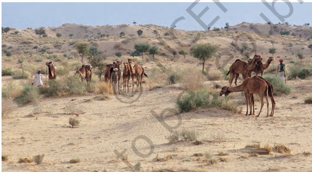
चित्र 5 - पश्चिमी राजस्थान के थार रेगिस्तान में चरते राइका समुदाय के ऊँट.

धंगर महाराष्ट्र का एक जाना-माना चरवाहा समुदाय है। बीसवीं सदी की शुरुआत में इस समुदाय की आबादी लगभग 4,67,000 थी। उनमें से ज्यादातर गड़रिये या चरवाहे थे हालाँकि कुछ लोग कम्बल और चादरें भी बनाते थे जबकि कुछ भैंस पालते थे। धंगर गड़रिये बरसात के दिनों में महाराष्ट्र के मध्य पठारों में रहते थे। यह एक अर्ध-शुष्क इलाका था जहाँ बारिश बहुत कम होती थी और मिट्टी भी खास उपजाऊ नहीं थी। चारों तरफ सिर्फ कंटीली झाड़ियाँ होती थीं। बाजरे जैसी सूखी फ़सलों के अलावा यहाँ और कुछ नहीं उगता था। मॉनसून में यह पट्टी धंगरों के जानवरों के लिए एक विशाल चरागाह बन जाती थी। अक्टूबर के आसपास धंगर बाजरे की कटाई करते थे और चरागाहों की तलाश में पश्चिम की तरफ चल पड़ते थे। करीब महीने भर पैदल चलने के बाद वे अपने रेवड़ों के साथ कोंकण के इलाके में जाकर डेरा डाल देते थे। अच्छी बारिश और उपजाऊ मिट्टी की बदौलत इस इलाके में खेती खूब होती थी। कोंकणी किसान भी इन चरवाहों का दिल खोलकर स्वागत करते थे। जिस समय धंगर कोंकण पहुँचते थे उसी समय कोंकण के किसानों को खरीफ़ की फ़सल काट कर अपने खेतों को रबी की फ़सल के लिए दोबारा उपजाऊ बनाना होता था।