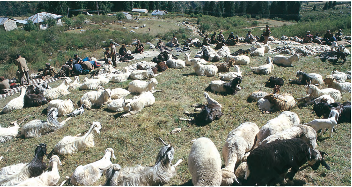
चित्र 3 - ऊन उतरने का इंतज़ार। हिमाचल प्रदेश स्थित पालमपुर के पास उहल घाटी.

और स्पीति के गाँवों में एक बार फिर कुछ समय के लिए रुकते। इस बीच वे गर्मियों की फ़सलें काटते और सर्दियों की फ़सलों की बुवाई करके आगे बढ़ जाते। यहाँ से वे अपने रेवड़ लेकर शिवालिक की पहाड़ियों में जाड़ों वाले चरागाहों में चले जाते और अगली अप्रैल में भेड़-बकरियाँ लेकर वे दोबारा गर्मियों के चरागाहों की तरफ़ रवाना हो जाते।