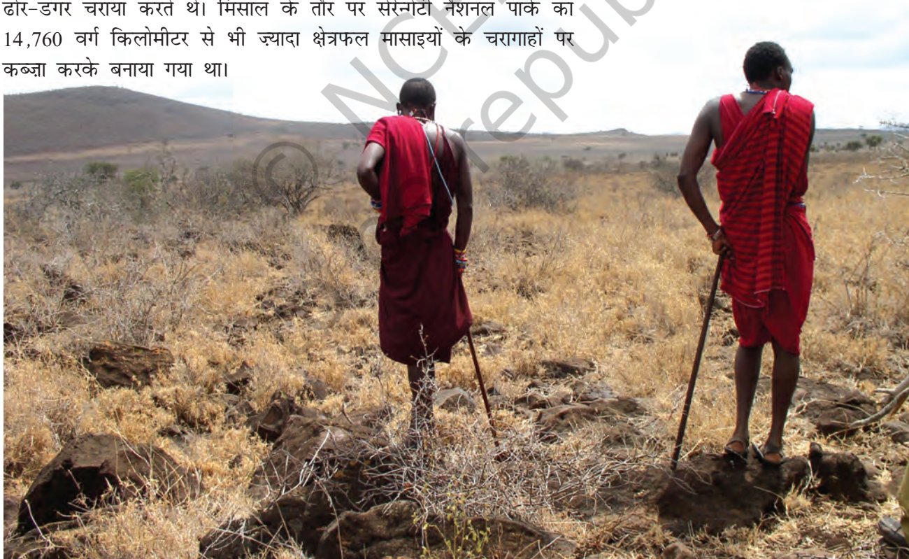
चित्र 14 - घास के बिना पशु (मवेशी, बकरियाँ और भेड़ें) कुपोषण का शिकार हो जाते हैं जिसका मतलब है कि चरवाहों के परिवारों और बच्चों के लिए भोजन कम पड़ने लगता है। सूखे और भोजन की सर्वाधिक कमी से ग्रस्त इलाका अम्बोसेली नैशनल पार्क के आसपास पड़ता है जिसकी पर्यटन से होने वाली आय पिछले साल लगभग 24 करोड़ कीनियन शिलिंग (लगभग 35 लाख अमेरिकी डॉलर) थी। किलिमंजारो जल परियोजना भी इसी इलाके से होकर जाती है लेकिन यहाँ रहने वाले समुदाय न तो पीने के लिए और न ही सिंचाई के लिए इस परियोजना के पानी का इस्तेमाल कर सकते हैं।

बहुत सारे चरागाहों को शिकारगाह बना दिया गया। कीनिया में मासाई मारा व साम्बुरू नैशनल पार्क और तंज़ानिया में सेरेन्गेटी पार्क जैसे शिकारगाह इसी तरह अस्तित्व में आए थे। इन आरक्षित जंगलों में चरवाहों का आना मना था। इन इलाकों में न तो वे शिकार कर सकते थे और न अपने जानवरों को चरा सकते थे। ऐसे बहुत सारे आरक्षित जंगलों में अब तक मासाई अपने ढोर-डंगर चराया करते थे। मिसाल के तौर पर सेरेन्गेटी नैशनल पार्क का 14,760 वर्ग किलोमीटर से भी ज़्यादा क्षेत्रफल मासाइयों के चरागाहों पर कब्ज़ा करके बनाया गया था।