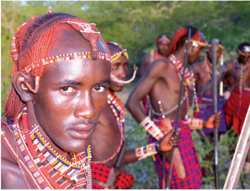
चित्र 17 - आज भी योद्धा बनने के लिए युवकों को व्यापक अनुष्ठानों से गुजरना पड़ता है हालाँकि अब यह प्रथा पहले जैसी प्रचलित नहीं है। इसके लिए युवकों को लगभग चार माह तक अपने कबीले के इलाके का दौरा करना पड़ता है। इस यात्रा के अंत में वे छापामारों की तरह दौड़कर अपने अहाते में चुसते हैं। इस समारोह के मौके पर युवक ढीले कपड़े पहनते हैं और पूरे दिन नाचते रहते हैं। इस अनुष्ठान के साथ ही वे जीवन के एक नए चरण में पहुँच जाते हैं। लड़कियों को इस तरह के अनुष्ठानों से नहीं गुजरना पड़ता।

युद्ध में बहादुरी का प्रदर्शन करके अपनी मर्दानगी साबित कर देते थे। फिर भी वे वरिष्ठ जनों के नीचे रह कर ही काम करते थे।